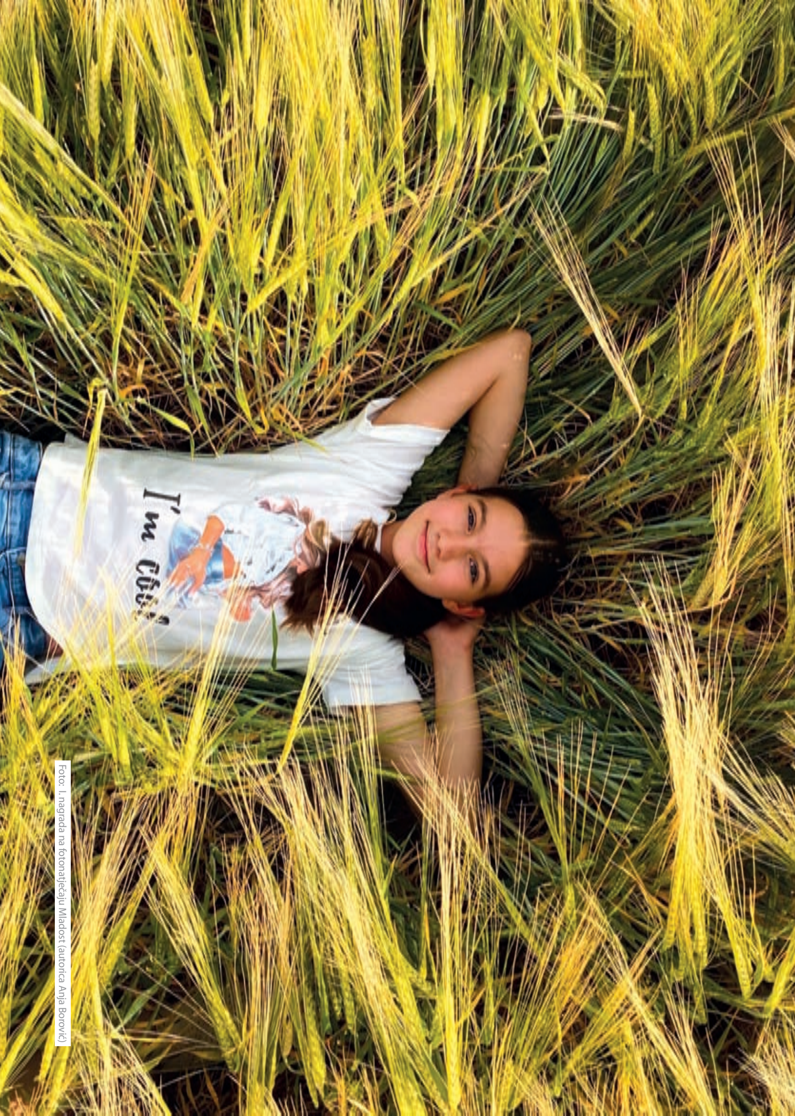
Foto: 1. nagrada na fotonaštrčanju Mladost