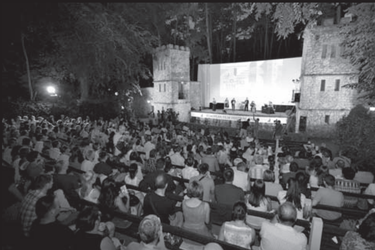
Festival europskog filma Palić