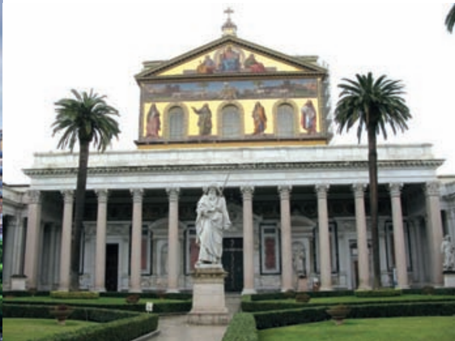
Bazilika sv. Pavla izvan zidina