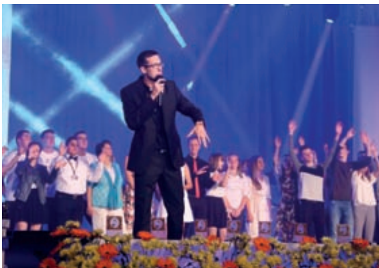
HosanaFest u Subotici