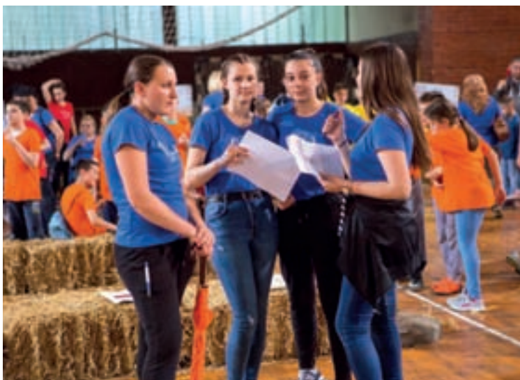
Animatorice na Dužijanci malenih