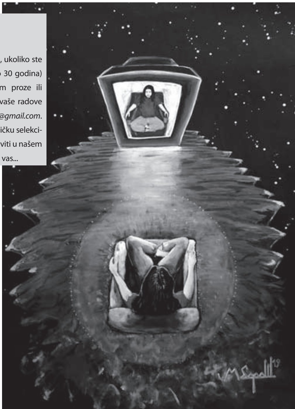
ART: Mišo Boroš