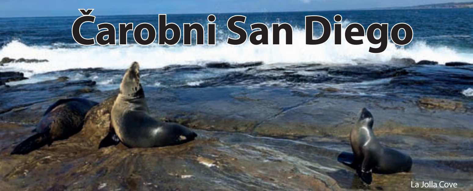
La Jolla Cove