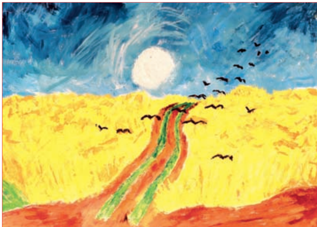
2. mjesto: Valentina Ostrogonac, 8. razred, OŠ Moša Pijade, Bereg