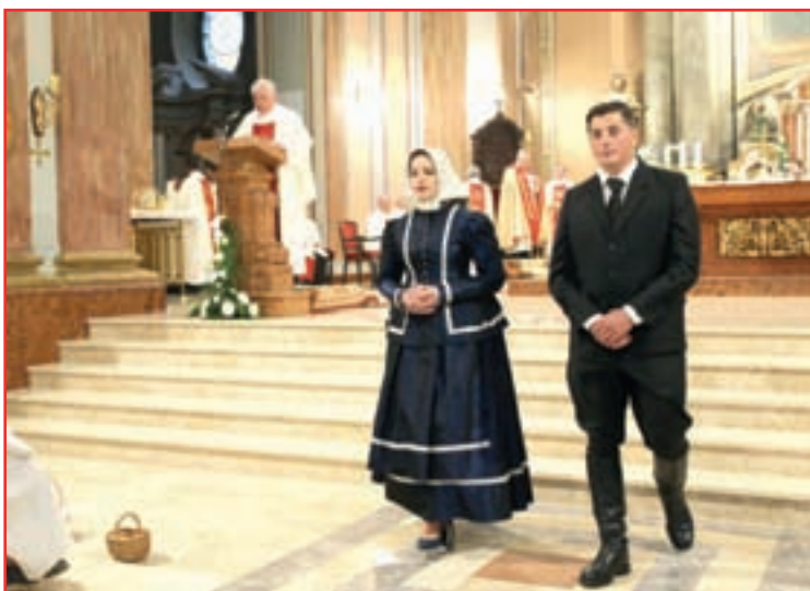
Bandašica i bandaš Dužijance 2018.