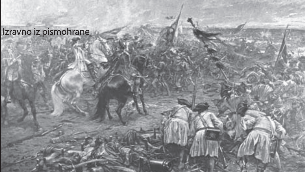
Bitka kod Sente, Franz Eisenhut (1896.)