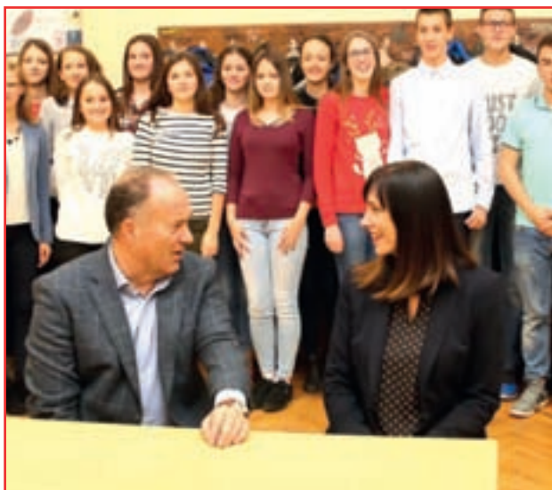
Ministri u gimnaziji