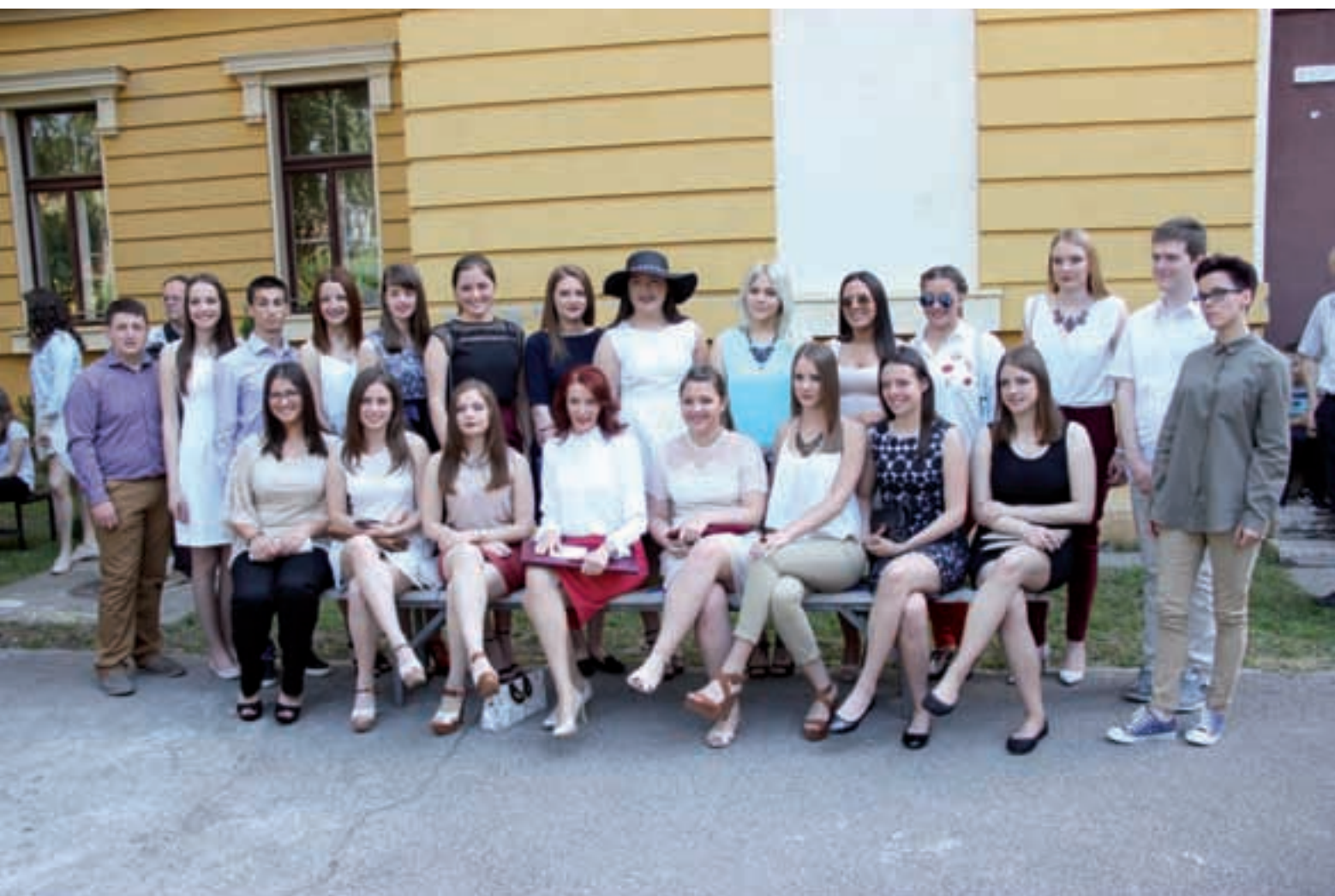
UČENICI 4. F ODJELA SUBOTIČKE GIMNAZIJE