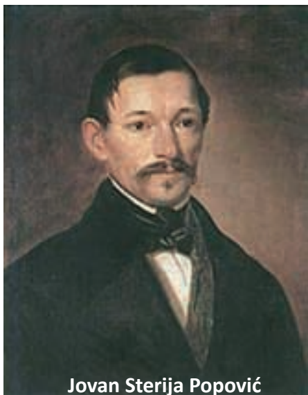
Jovan Sterija Popović

Osim pomenutog Nacionalnog dana Aromuna, u njihove najznačajnije projekte spada i glazbeni festival »Primuveara Ar-