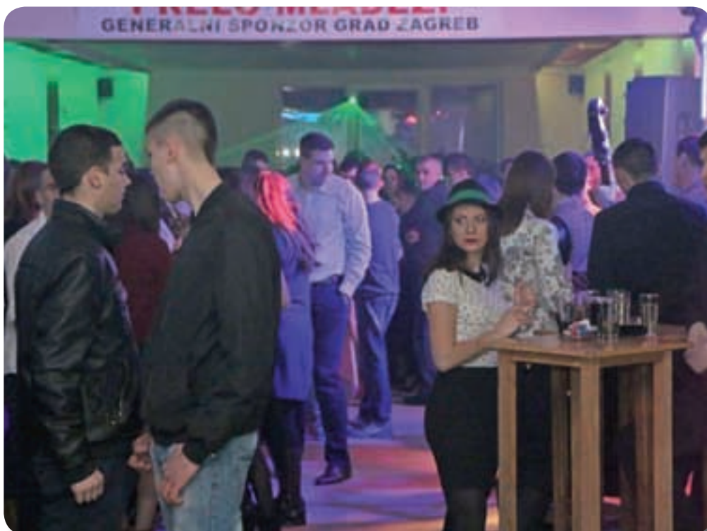
Prelo mladeži 2016.