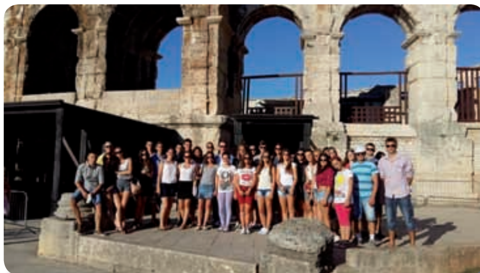
HKC »Bunjevačko kolo« u Puli