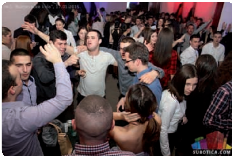
Prelo mladih u Dukatu