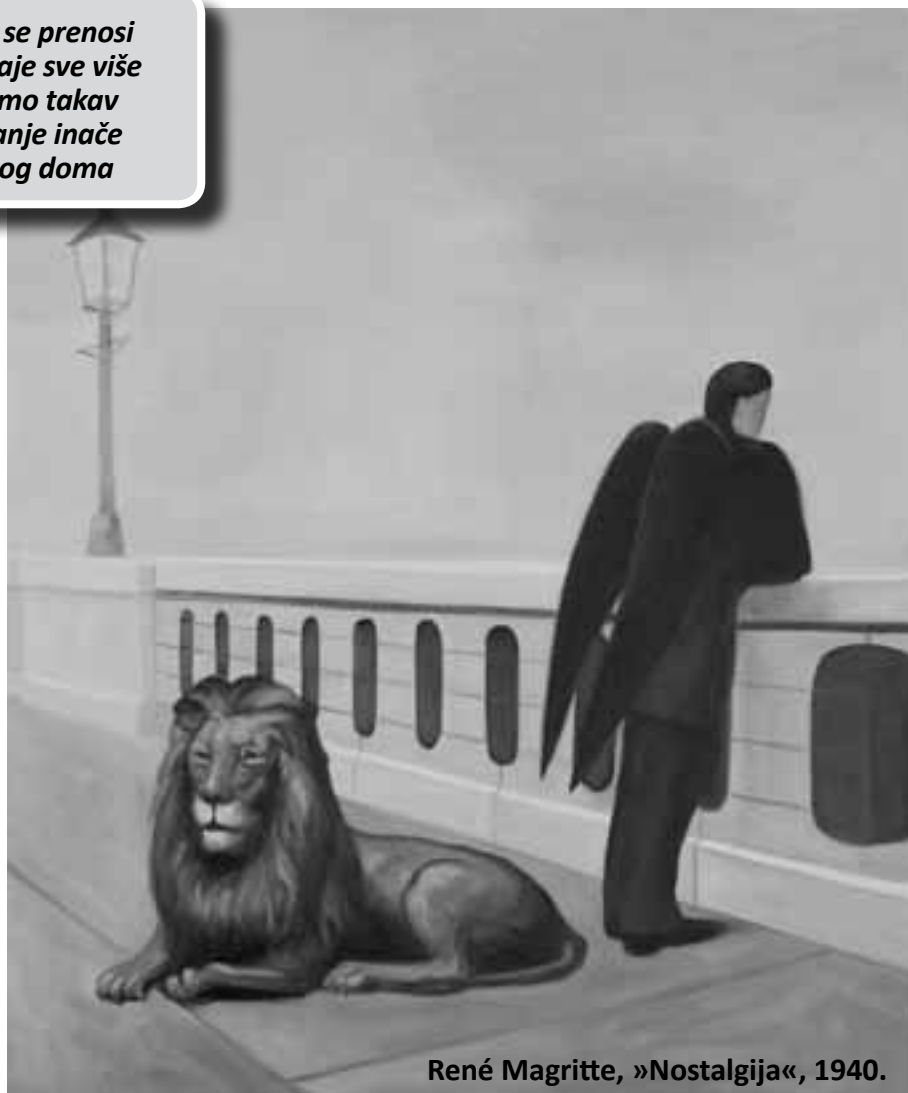
René Magritte, »Nostalgija«, 1940.

Jedna od bitnih značajki naše suvreme- nosti je to što, mimo naše pojedinačne volje, gubimo upravo taj osjećaj trajnosti doma koji nam prethodi i koji nas nad- življava. Ostanak u obiteljskoj kući koja se prenosi s generacije na generaciju postaje sve više rijetkost i, štoviše, doživljavamo ta- kav ostanak kao nužnost i sputavanje ina- če normalnog zasnivanja vlastitog doma. No, bez stolova i polica s knjigama koji se