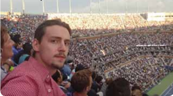
Naš reporter na Arthur Ashe stadionu

sko ozračje oko sebe? Gdje se drugdje može vidjeti tolika količina crveno bijelih kockica? Odgovor bi šokirao i posjetitelja s drugog planeta, kao i običnog smrtnika koji je samo želio tu večer gledati reprizu meksičke sapunice po peti put: upravo u Flushing Meadows javnome parku na rubu njujorške općine Queens.