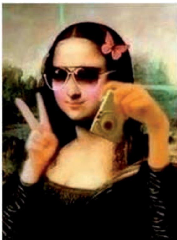
Mona Lisa selfie