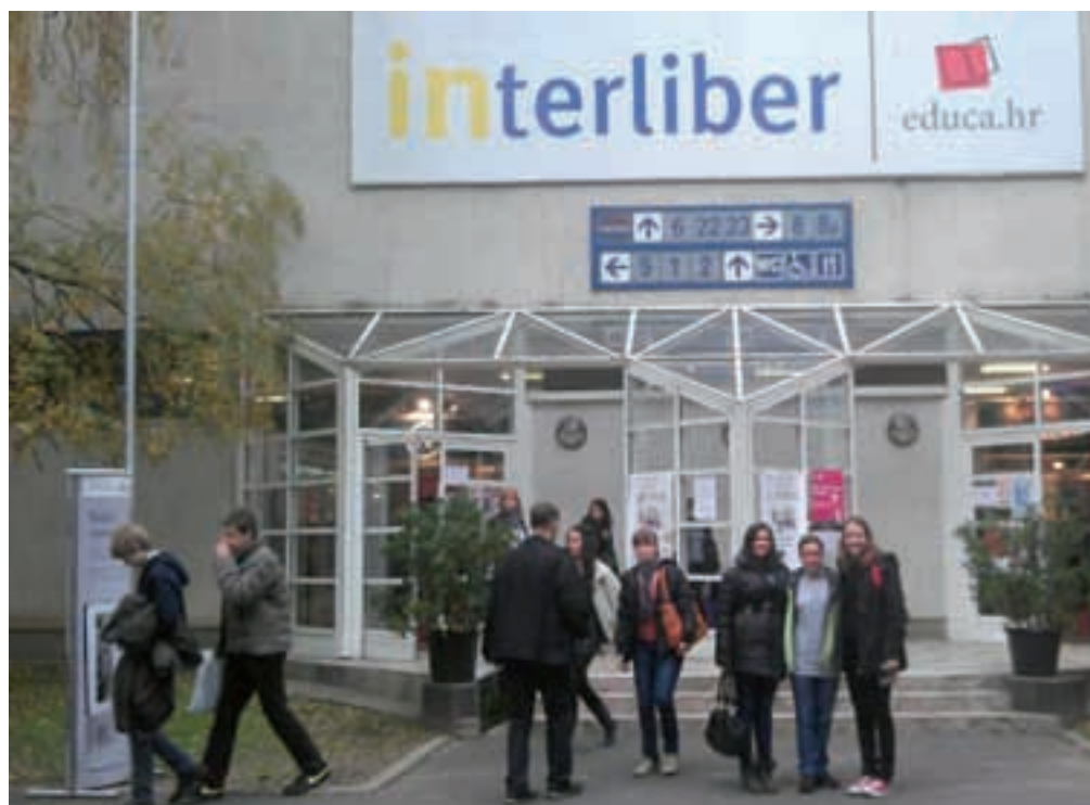
Bili smo na Interliberu