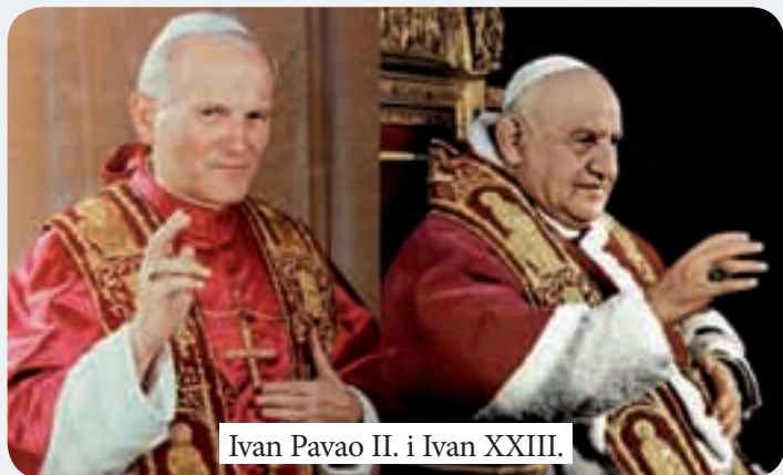
Ivan Pavao II. i Ivan XXIII.

Svečanost povijesne kanonizacije na trgu ukrašenom s 30.000 ruža, darom iz Ekvadora, počela je molitvom Milosrdne krunice, uz pjevanje zbora Rimske biskupije. Euharistijsko slavlje počelo je litanijama svetaca. Nakon tri zahtjeva koja je Papi uputio pročelnik Kongregacije za proglašenje svetih kardinal Angelo Amato , u pratnji postulatora, papa