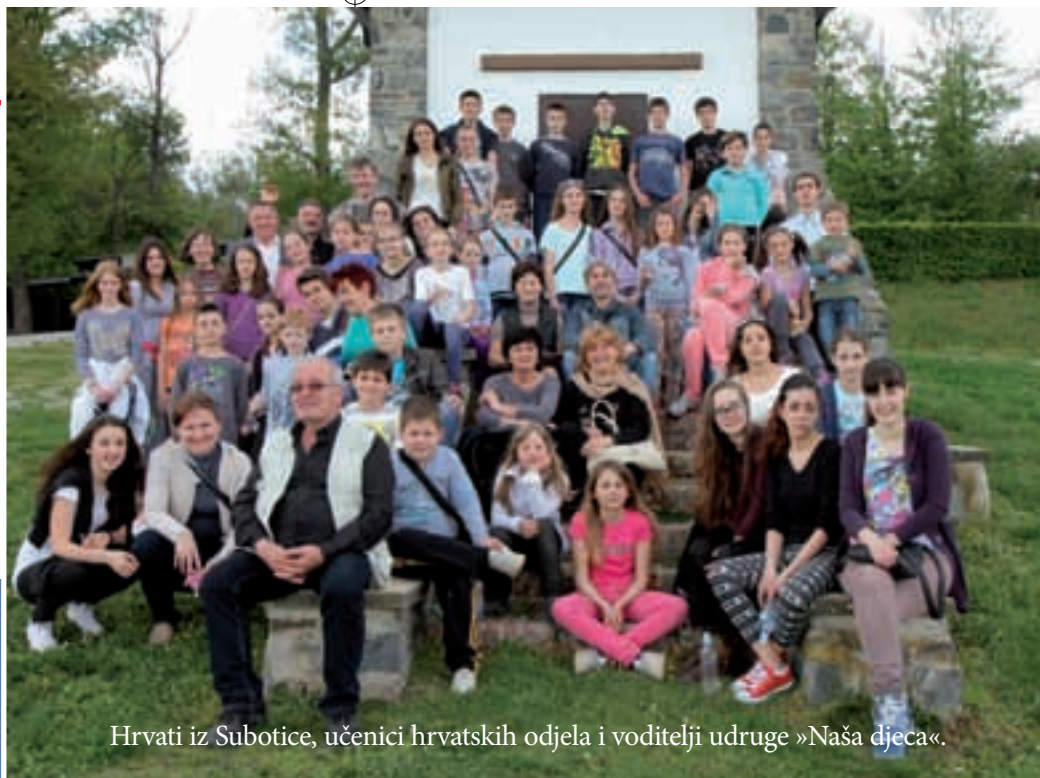
Hrvati iz Subotice, učenici hrvatskih odjela i voditelji udruge »Naša djeca«.