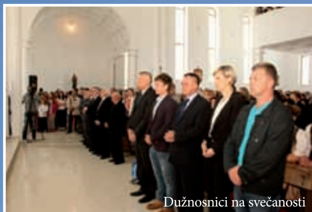
Dužnosnici na svečanosti

Kada su u prvim godinama Domovinskog rata Hrvati, Srijemci, uglavnom iz sela Hrtkovaca morali napustiti svoje domove, utočište, svoj novi dom našli su u Kuli, selu bez crkve u Požeškoj kotlini.