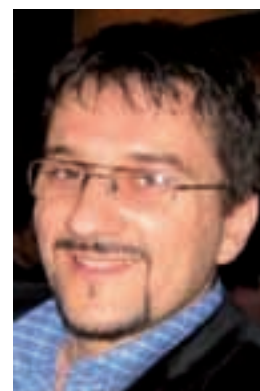
Piše: Marjan Antić urednik web-sajta