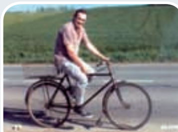
Piše: Branko Ivković

Faljni čeljadi. Mi jevo ode, na kraj Ivković šora na dolu baš postajali malo s sijanjom kuruza. Ta ugrijeđu se ove rđave mašine, a i mi se malo moramo okripit, popit malo koju litru dobrog vina i prodivanit koju kako Bog zapovida. Ode