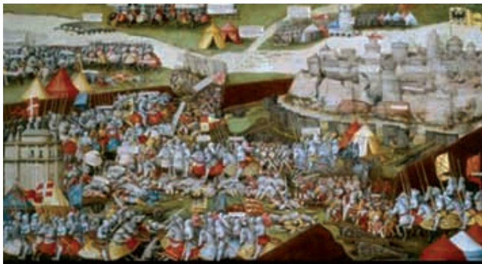
Bitka kod Pavije

Vijesti iz Bačke županije – U plemenitoj javnosti županije živi je interes izazvao sukob između obitelji Török iz Enyiga i Sulyoka iz Lekcsea oko posjedovanje utvrde i posjeda