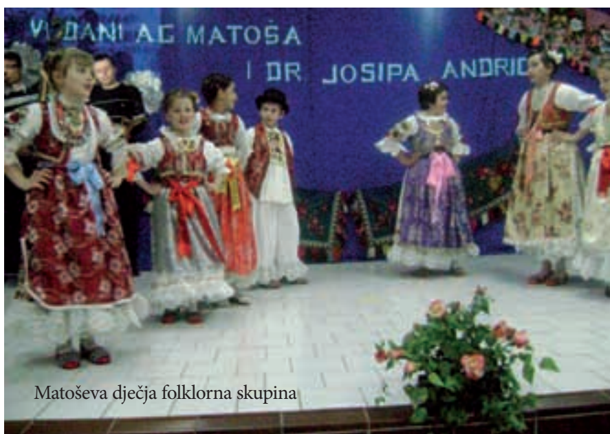
Matoševa dječja folklorna skupina