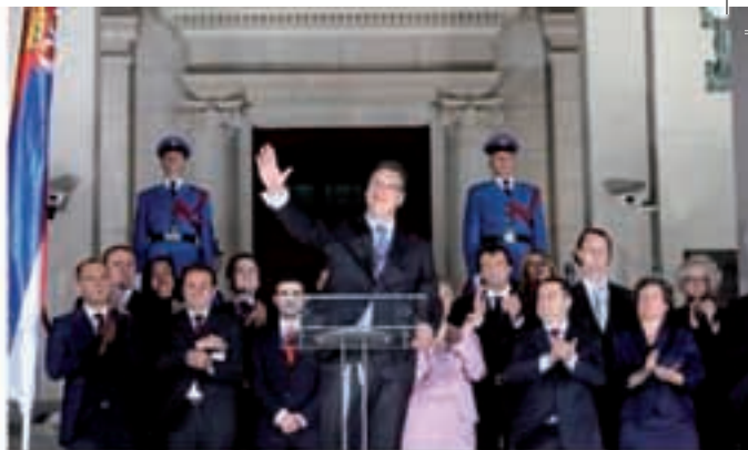
IZABRANA NOVA VLADA

Subotica, 2. svibnja 2014. Cijena 50 dinara