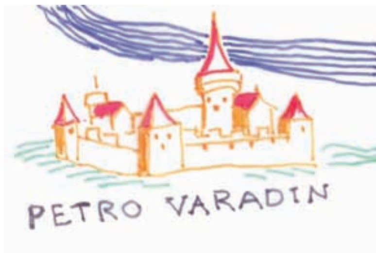
Aksonometrijska skica tvrđave iz 1566. godine

snaga uoči napada na Beč. Na donjoj strani te karte je prikazan »Petro Varadin« jednim malim crtežom. Na kartama iz tog doba bilo je uobičajeno da veći gradovi ili tvrđave budu prikazani određenim crtežom, više kao simbolom, nego kao stvarnim stanjem. Međutim, kada se crtež malo uveća i usporedi s već spomenutim osnovama, dolazimo do fascinantnog otkrića. Aksonometrijska skica Petro Varadina identična je osnovi iz Karlsruhea, ali i ono