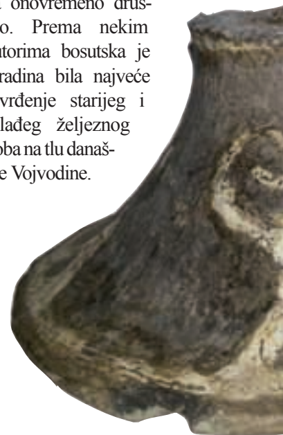
13. prosinca 2013.

Najveći doprinos znanosti Gradina pruža preko slojeva starijeg željeznog doba, koji ovdje iznose preko 3,5 metra, dok ukupna visina profila iznosi oko 7 metara, tako da činjenica da više od polovice pripada starijem željeznom dobu, govori o važnosti ovog naselja za onovremeno društvo. Prema nekim autorima bosutska je Gradina bila najveće utvrđenje starijeg i mlađeg željeznog doba na tlu današnje Vojvodine.