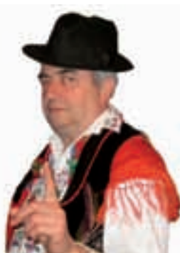
Piše: Ivan Andrašić