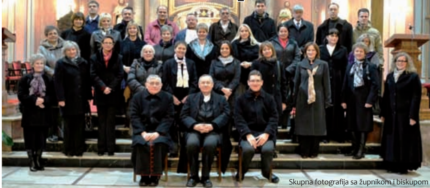
Skupna fotografija sa župnikom i biskupom

P olusatnim koncertom i biskupskom svetom misom zahvalnicom kojom su se ujedno prisjetili svih pokojnih suradnika, pjevača i glazbenika, Katedralni zbor »Albe Vidaković« iz Subotice je u nedjelju proslavio 40 godina djelovanja. Za ovaj svečarski nastup u svojem matičnom prostoru – subotičkoj katedrali-bazilici sv. Terezije Avilske – zbor je uz Vidakovićev »Magnificat« izveo nekoliko skladbi Milana Asića , koje je ovaj skladatelj