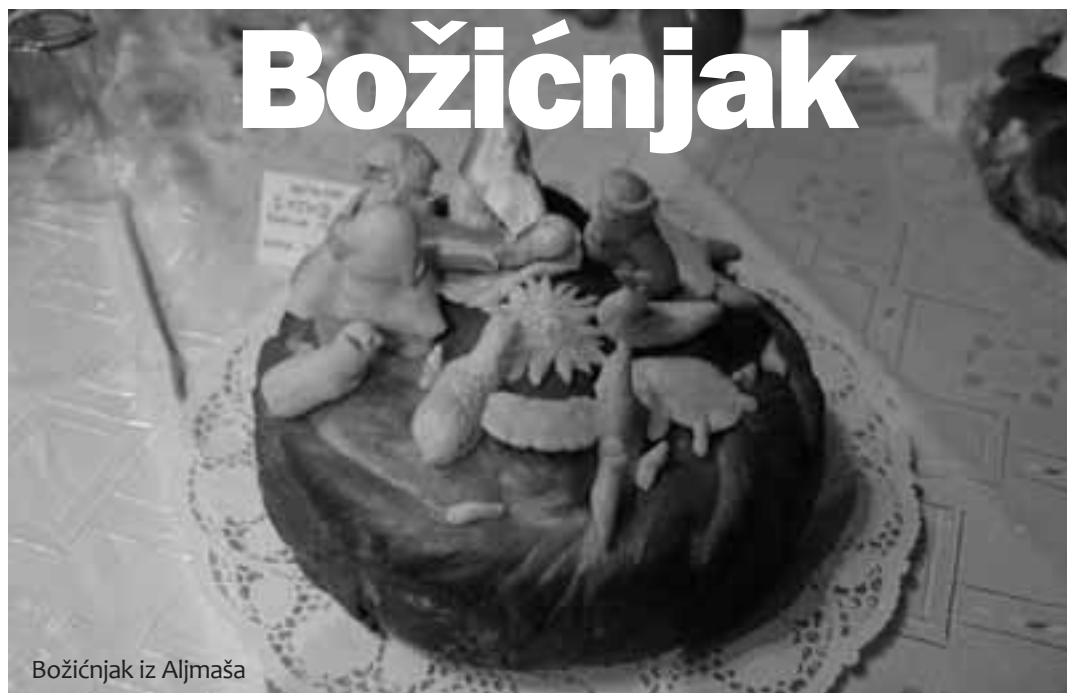
Božićnjak iz Aljmaša

Uponediljak, 9. prosinca 2013, u mistu za izložbe u našoj dičnoj Varoškoj kući otvorena je 17. po redu izložba božićnjaka, koju je priredilo Katoličko društvo za kulturu, povijest i duhovnost »Ivan Antunović« iz Subotice. To je počelo. Za gledače će izložba bit otvorena nedilju dana, do 16. prosinca tj. do prvog dana posli Materica.