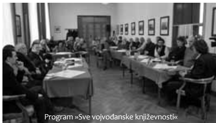
Program »Sve vojvođanske književnosti«

U okviru programa »Vojvodina – Regija u regionu« u utorak je održano predstavljanje pod nazivom »Sve vojvođanske književnosti«.