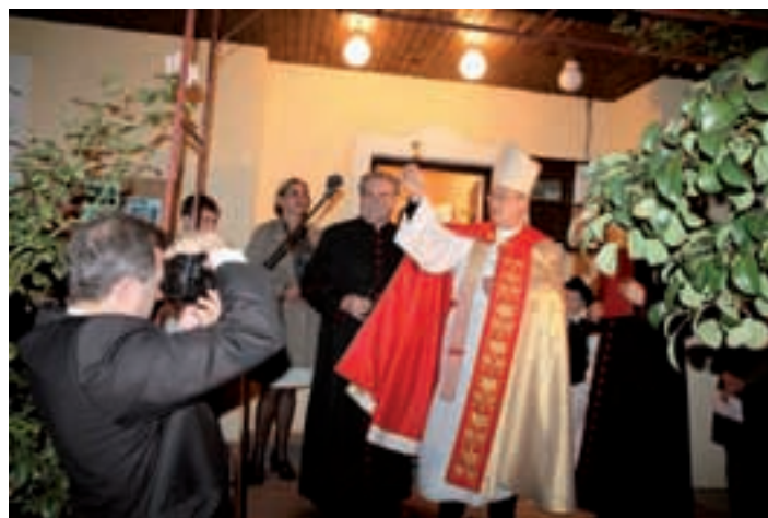
Biskup Penzes blagoslovio je dvorište, gdje se djeca igraju, i sam objekt u kojem djeca borave