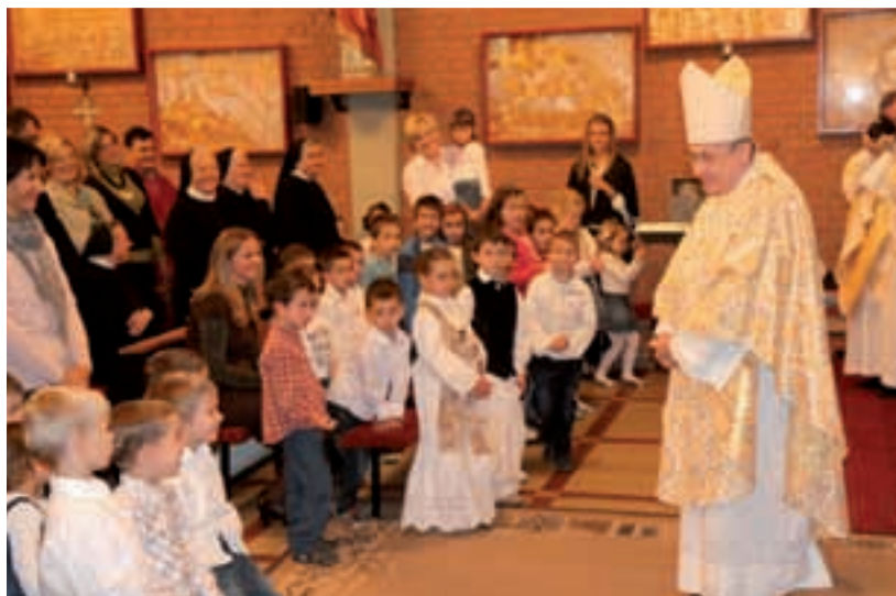
Nakon misnog slavlja biskup je s djecom razgovarao i o svojim dogodovštinama iz vrtića kada je on bio mali