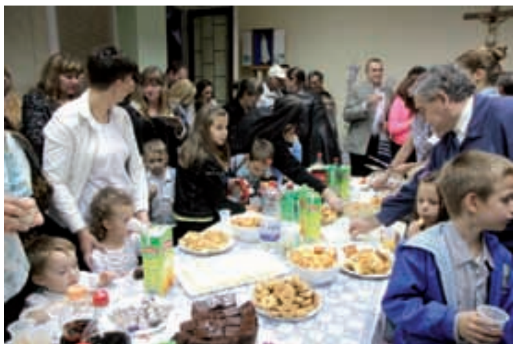
Druženje mališana, roditelja i uzvanika nakon otvorenja.