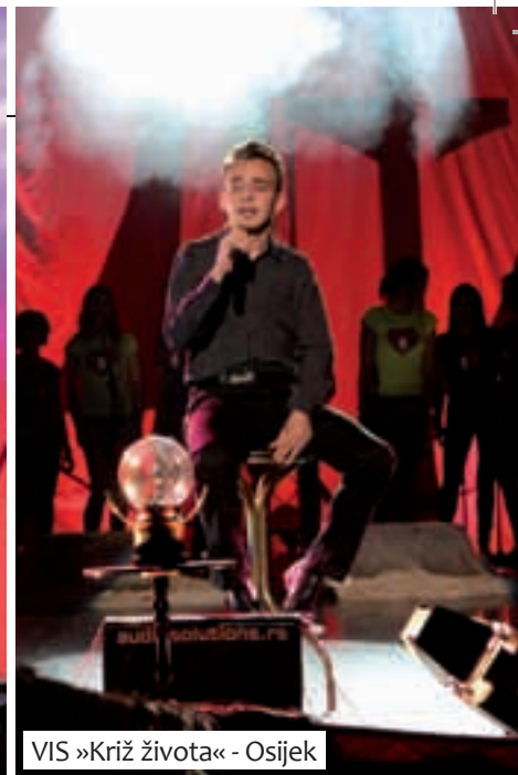
VIS »Križ života« - Osijek