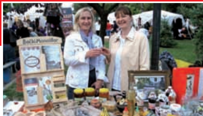
Monoštorke s tradicionalnim rukotvorinama – šokačke šule, drvene klompe, tkane torbice, pčelarski proizvodi, ručno rađen nakit, sokovi, pekmez...

Sajam je okupio oko 180 ženskih udruga iz 39 vojvođanskih općina i gradova, kao i ženske udruge iz Rumunjske i Mađarske. Predstavljene su autentične rukotvorine i proizvodi starih zanata koji čuvaju tradiciju i bogato kulturno naslijeđe vojvođanskog