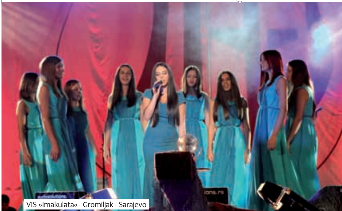
VIS »Imakulata« - Gromiljak - Sarajevo