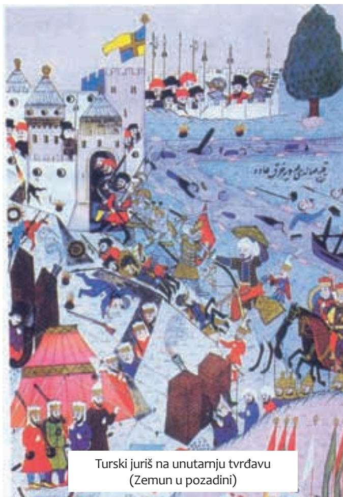
Turski juriš na unutarnju tvrđavu (Zemun u pozadini)

Hunyadi sa svojom profesionalnom vojskom i Ivan Kapistran koji je predvodio uglavnom vojno neiskusne križare (uglavnom Hrvate i Mađare) zakasnili su na bojište, jer je turska opsada već bila počela kada su dvije kršćanske vojske stigle i ulogorile se ispod Zemuna. Hunyadi je ubrzo uvidio kako sve snage mora koncentrirati na proboj riječne blokade, pa su dereglije, okupljene kod Slankamena, 14. srpnja krenule u žestoki napad na tursku riječnu flotilu. Šajkaši, koji su uglavnom bili Srbi, uspjeli su probiti blokadu i potopiti nekoliko tur-