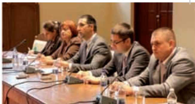
SJEDNICA DVA SKUPSTINSKA ODBORA U SUBOTICI

Subotica, 27. rujna 2013. Cijena 50 dinara