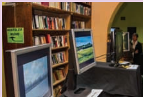
Misto za ruvo!

Franklin: Ili napiši nešto vrijedno čitanja, ili uradi nešto vrijedno pisanja.