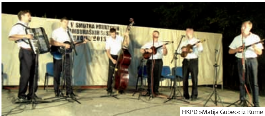
HKPD »Matija Gubec« iz Rume

Na smotri su nastupili sastavi sa sjevera Bačke, po jedan iz Podunavlja i Srijema, ali iz Mađarske: Ženska tamburaška skupina »Golubice« iz Subotice, Kulturno-prosvjetna zajednica Hrvata »Šokadija« iz Sonte, Hrvatsko kulturno-prosvjetno društvo »Matija Gubec« iz Rume, Tamburaški sastav »Šokadija« iz Mohača, domaćini Hrvatsko kulturno-umjetničko društvo »Ljutovo« iz Ljutova, te kao specijalni gosti – Tamburaški sastav »Hajo« iz Subotice, koji ove godine slavi 25 godina rada. Inače, HKUD »Ljutovo« trenutno radi samo s tamburaškom sekcijom, ali imaju i skupinu mladih polaznika, koja se s nekoliko numera također predstavila na smotri.