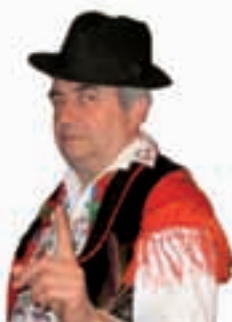
Piše: Ivan Andrašić