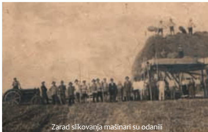
Zarad slikovanja mašinari su odanili

Za rad na mašini sam se i ja otimo. Kad smo oskudovali, šporovali na rani u obnove zemlje , na cidulju smo mogli kupit ograničeno kruva el brašna misto kruva. Puk je bio više gladan neg sit. Za dobrovoljni rad na mašini, kao privilegiju zaposlenima u