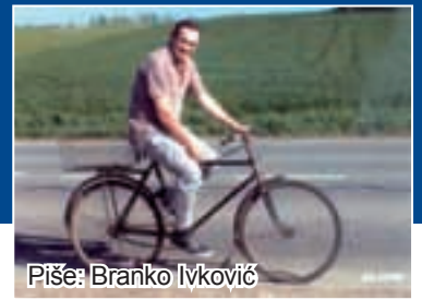
Piše: Branko Ivković