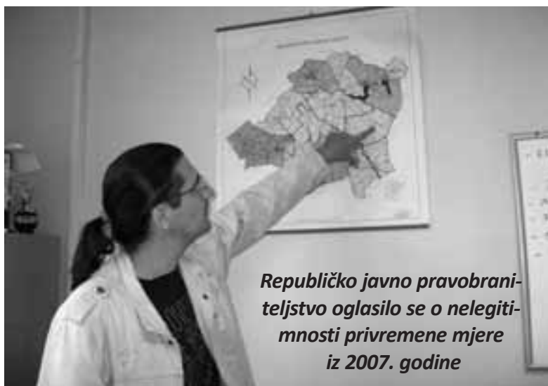
Republičko javno pravobraniteljstvo oglasilo se o nelegitimnosti privremene mjere iz 2007. godine

Ukidanje nekadašnje privremene mjere kojom je 2007. godine poljoprivredno zemljište u državnoj svojini vraćeno katoličkoj, pravoslavnoj i evangelističkoj crkvi u Subotici, trebalo je biti glavna točka dnevnog reda na izvanrednoj sjednici Skupštine Grada, koja u utorak 10. rujna nije održana zbog nedostatka kvoruma. U nastojanju pojašnjavanja problematike koja je nastala u svezi s ovim zemljištem, zamolili smo Grgura Stipića , šefa Ureda za poljoprivredno zemljište u državnoj svojini, za kraći razgovor na ovu temu.