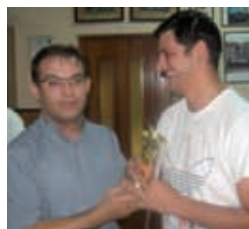
Vič. Tovilo s predstavnicima domaćina i gostujućih momčadi