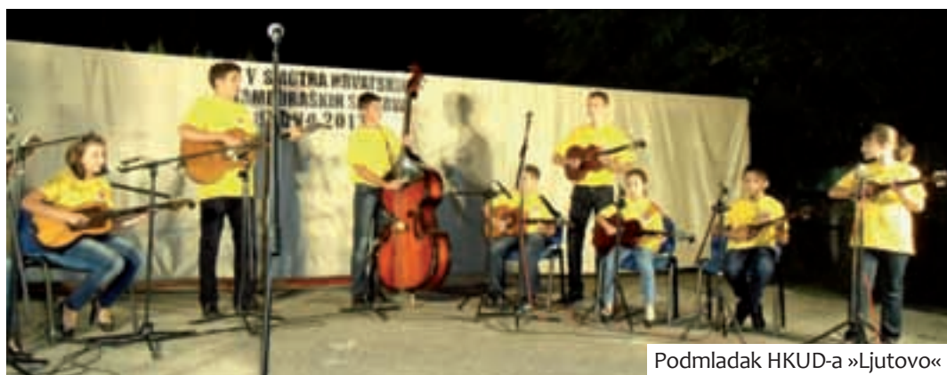
Podmladak HKUD-a »Ljutovo«