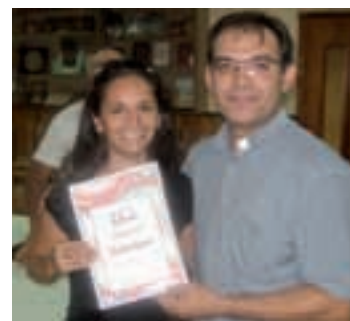
Vič. Tovilo s najboljima i najljepšom

P od pokroviteljstvom župne crkve Uzvišenja Svetog Križa u Rumi i Hrvatskog kulturno-prosvjetnog društva »Matija Gubec«, na terenima FK »Jedinstva« u Rumi je u nedjelju, 8. rujna 2013. godine, održan tradicionalni malonogometni turnir hrvatskih udruga iz Srijema. Ove su godine na turniru sudjelovale momčadi četiriju hrvatskih udruga. Pokraj tima domaćina sudjelovali su i timovi HKUD-a