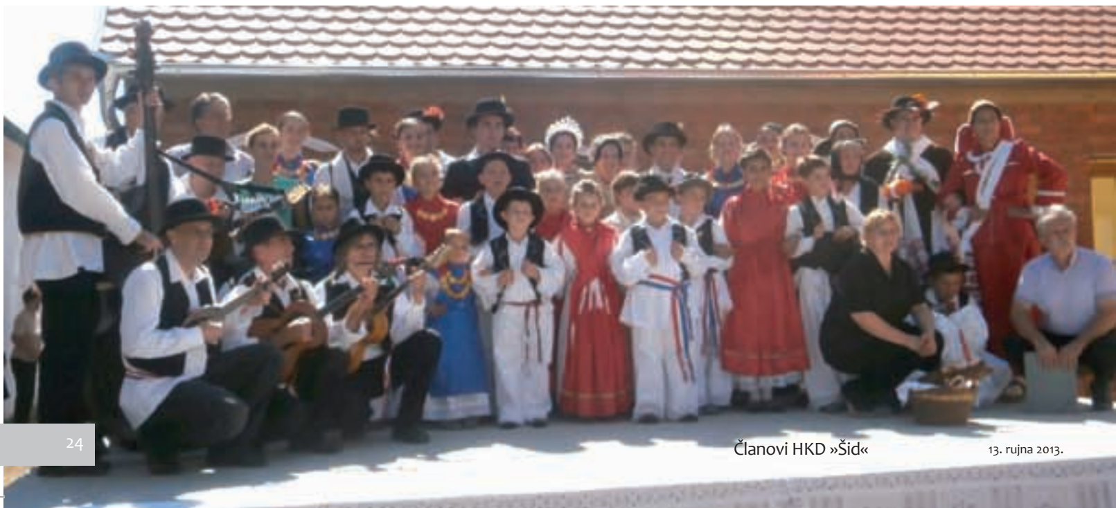
Članovi HKD »Šid«