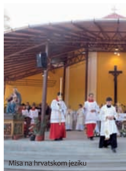
Misa na hrvatskom jeziku

otvorenom oltaru pratilo je nekoliko stotina vjernika. U nadahnutoj propovijedi velečasni Dragan Muharem istaknuo je da je povod za okupljanje proslava rođendana naše majke. »Svako rođenje djeteta u ljudskoj obitelji rađa radost, a danas se rađa ona čiji život označava prekretnicu cijele ljudske povijesti. Ona nije samo prekretnica za njezine roditelje Joakima i Anu , nego i za cijelo čovječanstvo. Rađa se ona 'koja ima roditi onoga čiji je iskon