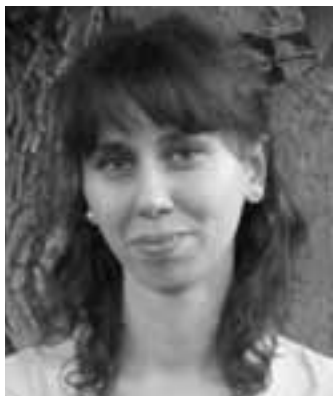
Piše: dipl. theol. Ana Hodak

K roz svoju riječ Bog nam se objavljuje kao milosrdan i pun ljubavi za čovjeka, čak i onda kada mu čovjek okrene leđa. Da njegovo milosrđe i ljubav nemaju granice i da za svakog grešnika ima nade najbolje nam pokazuju Isusove prisposode koje pred nas stavlja evanđeoski odlomak dvadeset i četvrte nedjelje kroz godinu (Lk 15, 1-32).