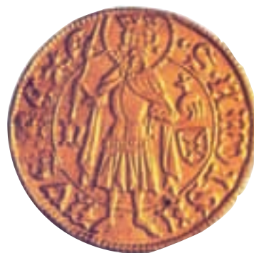
Novac kovan za vrijeme namjesnika Hunyadija