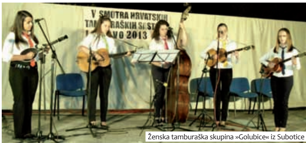
Ženska tamburaška skupina »Golubice« iz Subotice

»Nakon pet godina postojanja ove smotre organizacija je sve bolja, imamo određeno iskustvo pa neke probleme možemo predvidjeti i samim tim im pravovremeno doskočiti. U ovom organizacijskom sastavu smotra u idućih pet godina zasigurno ima svoj potencijal i snagu. Smatram