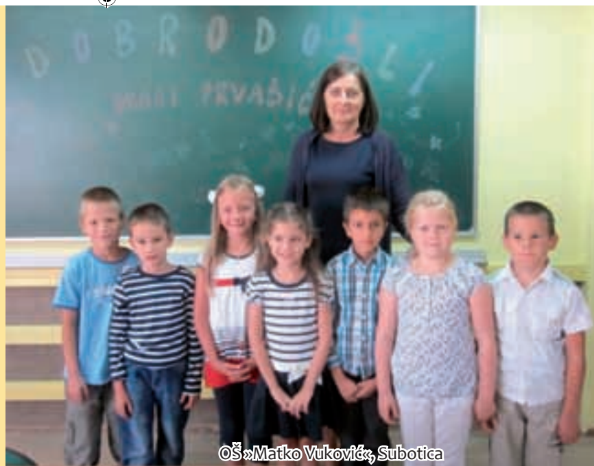
OŠ »Matko Vuković«, Subotica