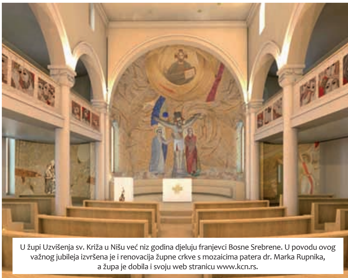
U župi Uzvišenja sv. Križa u Nišu već niz godina djeluju franjevci Bosne Srebrene. U povodu ovog važnog jubileja izvršena je i renovacija župne crkve s mozaicima patera dr. Marka Rupnika, a župa je dobila i svoju web stranicu www.kcn.rs .

koja je do sada nosila titulu Presveto srce Isusovo, dok je prije dvije godine nadbiskup Hočevar zajedno s župnikom, ostavljajući onaj stari, dodao kao primus titulus Uzvišenje svetoga Križa koje se slavi