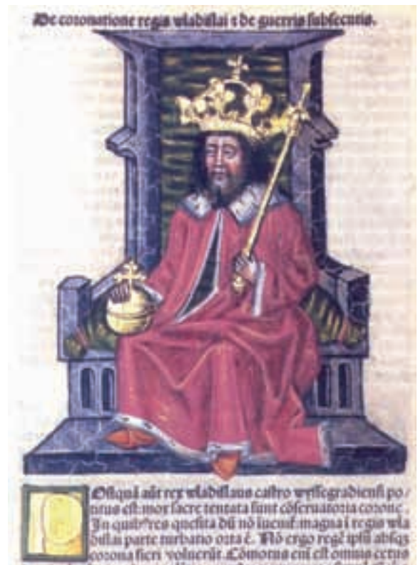
Vladislav I. na tronu (ilustracija u kronici)

U međuvremenu je Elizabeta rodila sina Ladislava , njena dvorkinja je ukrala krunu sv. Stjepana i u svibnju u Stonom Beogradu (Székesfehérvár) okrunili su novorođenče za kralja pod imenom Ladislav V. Poljski kralj Vladislav III. je dva mjeseca kasnije okrunjen za hrvatsko-ugarskog kralja pod imenom Vladislav I. diademom sv. Stjepana (budući da je kruna sv. Stjepana ukradena). Pikanterija dviju krunidbi je u tome da je krunidbu oba puta izvršio kardinal i ostragonski nadbiskup Dénes Szécsi . Nakon ovih događanja građanski rat je bio neizbježan. Kraljica majka Elizabet se obratila rođaku Fridriku Habsburškom za pomoć, kome je ugarsku krunu dala u zalog. Na njoj strani su bili grof Ulrih Celjski , Frankopani i Branković , a većina hrvatskih i ugarskih velikaša, među njima i braća Talovci i Ivan Hunjadi , u narodnim pjesmama poznat kao Janko Sibirjanin , podržavali su Vladislava I. Njegove su trupe pobijedile slavenske barone Ladislava Gorjanskog i Ivana od Korođa . U ovim se borbama istaknuo Ivan Hunjadi , kojeg je Vladislav I. imenovao za namjesnika Erdelja (ovu titulu je izvjesno vrijeme dijelio s Nikolom Iločkim ) i za kapetana Beograda, praktički obrane južnih granica kraljevstva. Rezultat ovih borbi je bio da su 1442.