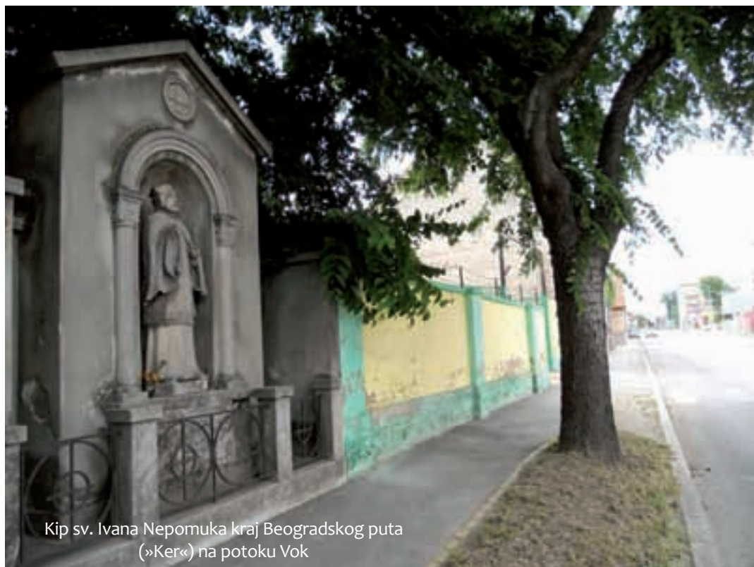
Kip sv. Ivana Nepomuka kraj Beogradskog puta (»Ker«) na potoku Vok

U završnici serije tekstova o potocima i jezerima u prošlosti Subotice * Osim što se u seriji tekstova govori o nepoznatim ili nedovoljno poznatim aspektima prošlosti grada, ujedno se predlaže da se na nekadašnjim vodenim trasama, gdje su očuvani tragovi stare Subotice, oni adekvatno obilježe