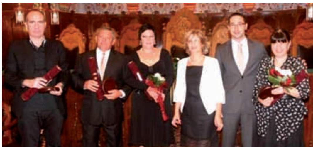
Dobitnici priznanja »Pro urbe«