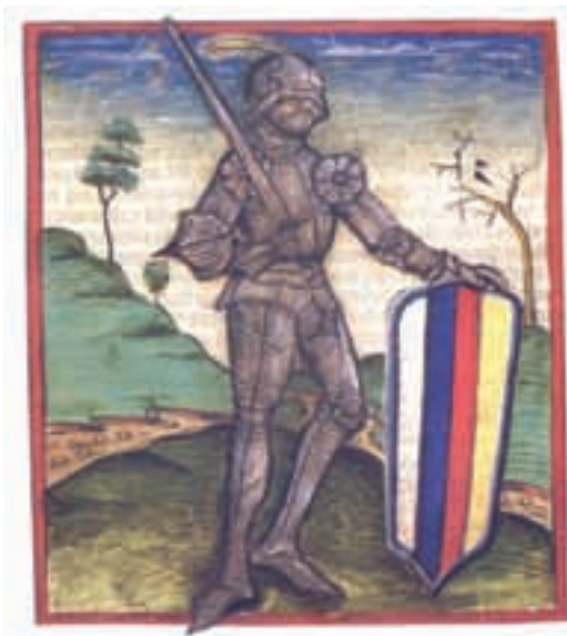
Ivan Hunjadi u oklopu (ilustracija u kronici)

je boravila i trudna Albertova udovica (kćerka Sigismunda iz obitelji Celjski ), kojoj je bilo namijenjeno udati se za onog kandidata koga budu izabrali za kralja. »Iz dobro obaviještenih krugova tih vremena« zna se kako je bilo više kandidata, ali za potomstvo su sačuvala dvojica. Jedan je bio mladi despot Lazar Branković , sin Đurđev . Njega su kandidirali otac i šogor Ulrih Celjski . Drugi kandidat je bio šesnaestogodišnji Vladislav III. , poljski kralj na koga je na koncu pao izbor. S budimskog izbornog sabora krenuli su izaslanici zamoliti mladog kralja da zauzme hrvatsko-ugarsko