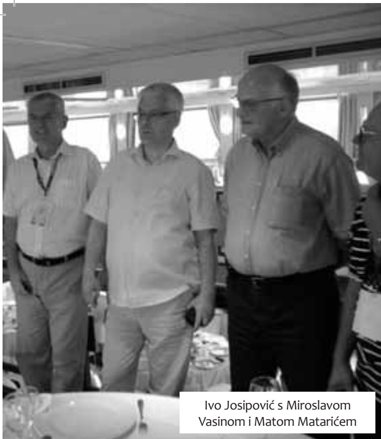
Ivo Josipović s Miroslavom Vasićem i Matom Matarićem

gla je više od 374 milijuna dolara 2011. godine, 2012. godine bila je nešto iznad 368 milijuna, a u prvoj polovici ove godine 148, 5 milijuna dolara. A, da su poljoprivreda i prehrambena industrija itekako važan izvozni adut Vojvodine pokazuje i to što među najznačajnije izvozne proizvode iz Vojvodine u Hrvatsku spadaju uljane pogače od soje i suncokreta, suncokretovo i sojino ulje, kukuruz. Među proizvode koje Vojvodina najviše uvozi iz Hrvatske su urea i ostala mineralna gnojiva.