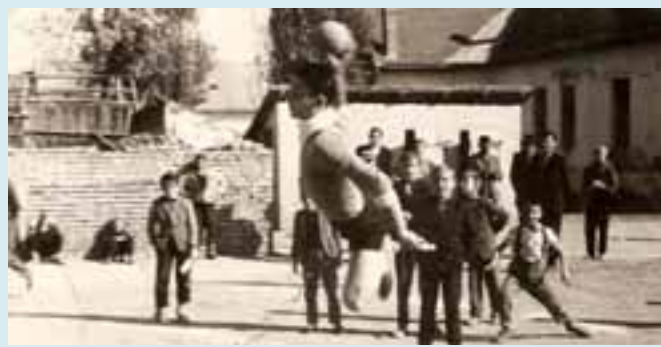
S treninga RK Partizan - sada RK Sonta