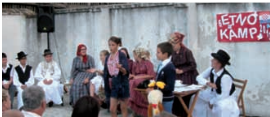
Scena iz predstave »Na more« koju je za ovu prigodu napisao Marjan Kiš