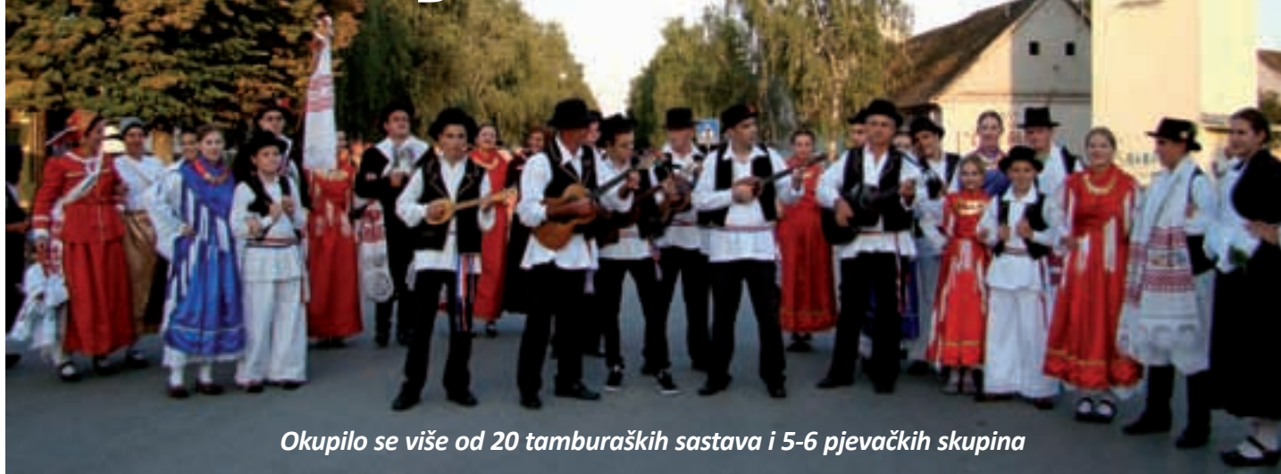
Okupilo se više od 20 tamburaških sastava i 5-6 pjevačkih skupina

Tenja, prigradsko osječko naselje, ovoga je vikenda obilježila 10. obljetnicu lijepa manifestacije nazvane »Slavonija u jesen si zlatna«, a kako jubilej i zaslužuje, program je bio bogat, pa su Tenju u četiri protekla dana posjetili brojni mještani Osijeka i okolice, a domaćini se hvale da su na brojnim priredbama prodali gotovo 10 tisuća ulaznica. Organizator je Centar za kulturu i sport Tenja i mjesni KUD »Josip Šošić«, a pokrovitelji su Osječko-baranjska županija, Grad Osijek i Osječka pivovara.