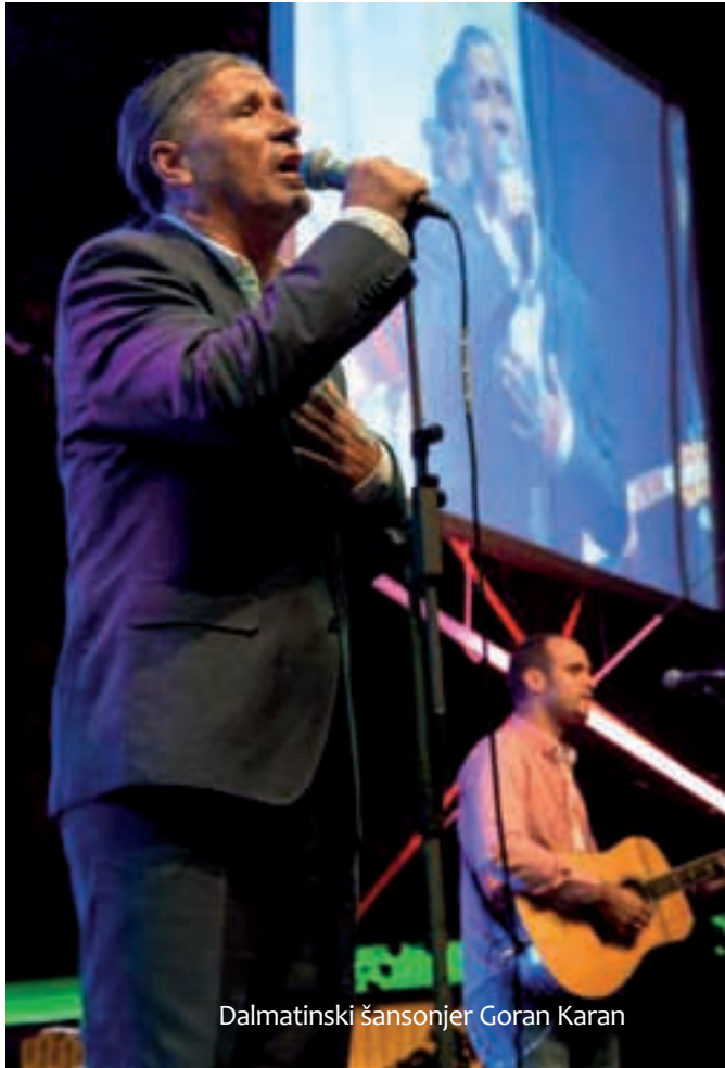
Dalmatinski šansonjer Goran Karan