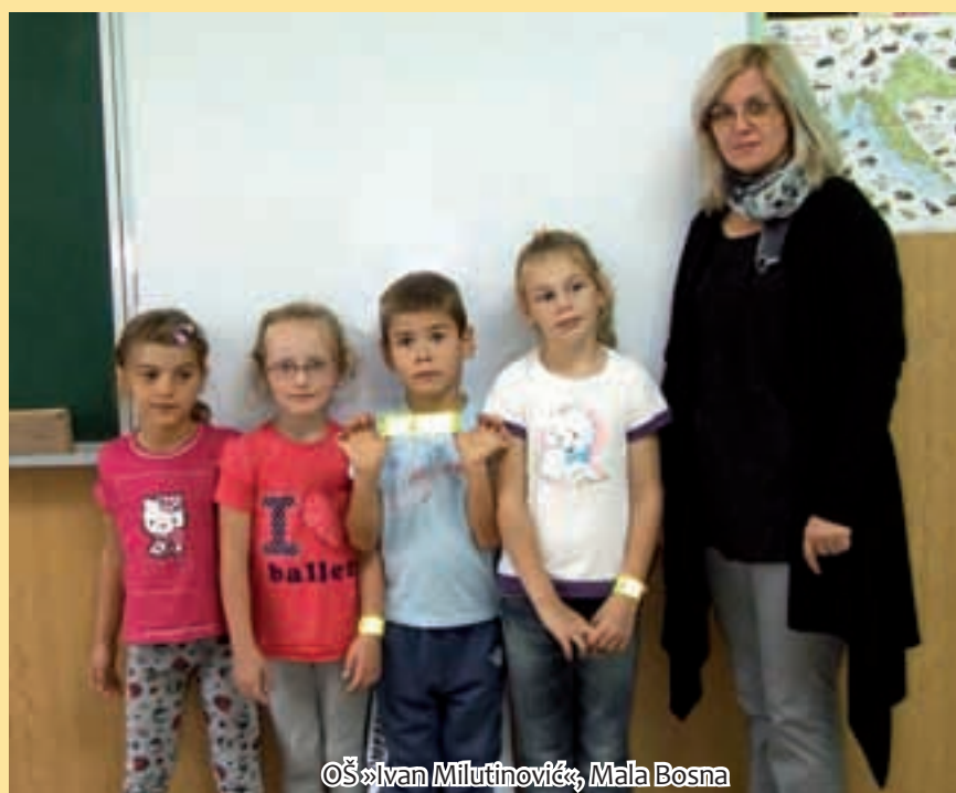
OŠ »Ivan Milutinović«, Mala Bosna