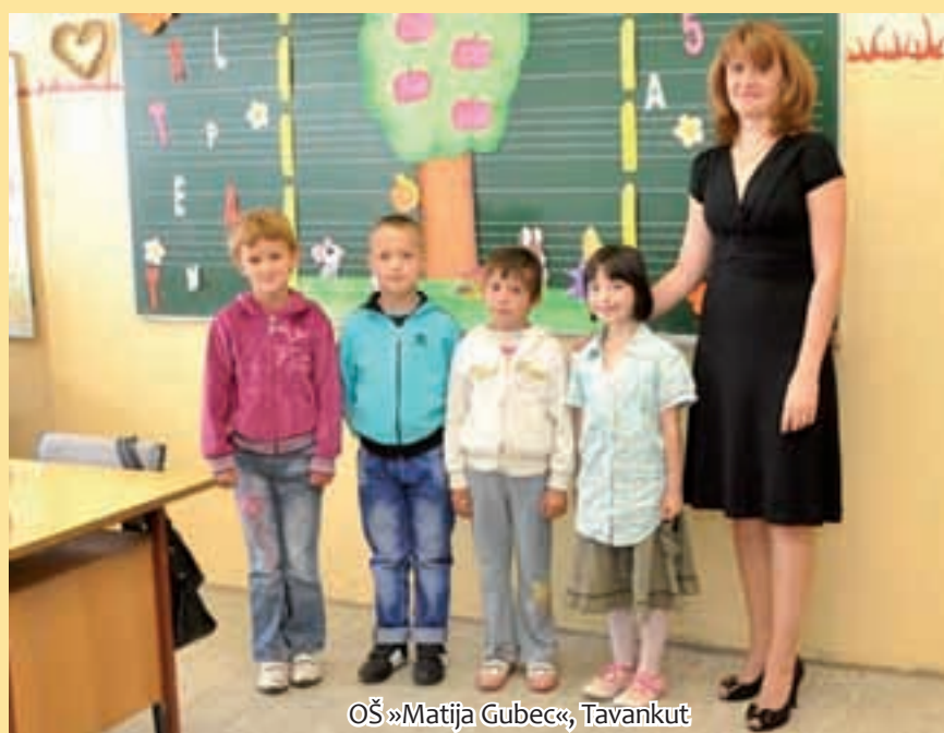
OŠ »Matija Gubec«, Tavankut