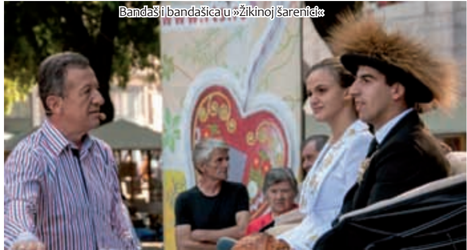
Bandaši i bandašica u »Žikinoj šarenici«