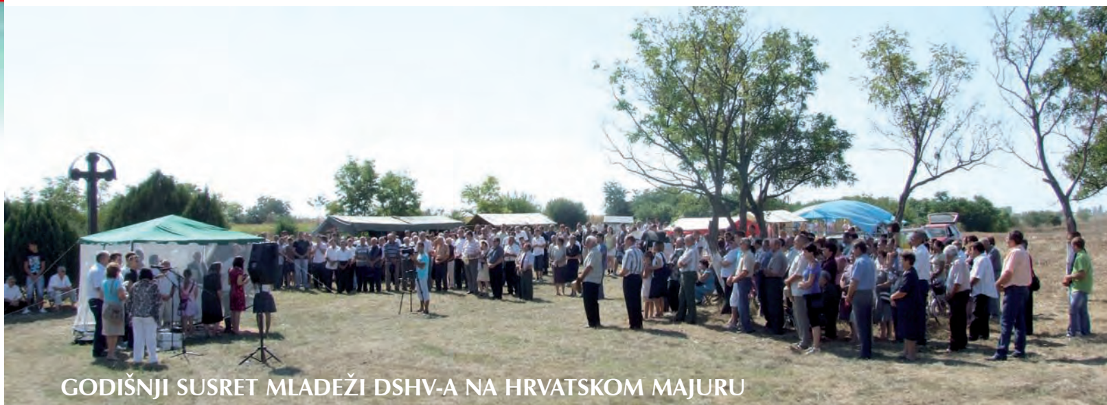
GODIŠNJI SUSRET MLADEŽI DSHV-A NA HRVATSKOM MAJURU