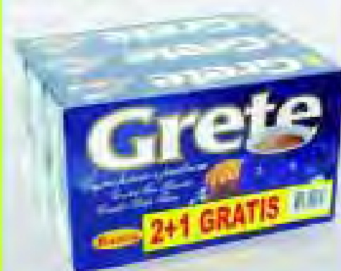
Keks Grete 230g 2+1GRATIS