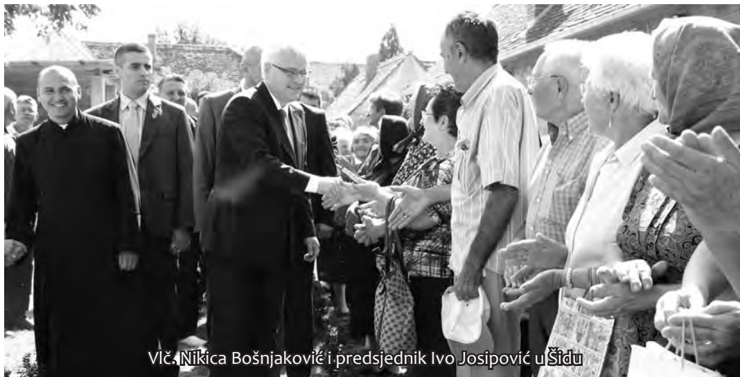
Vič. Nikica Bošnjaković i predsjednik Ivo Josipović u Šidu

elementima nacionalne kulture. »Međutim, još mnogo toga je i ostalo od onog što je proklamirano i nadam se da će to biti riješeno što političkim, što pravnim putem«, kazao je Bačić ukazujući na činjenicu