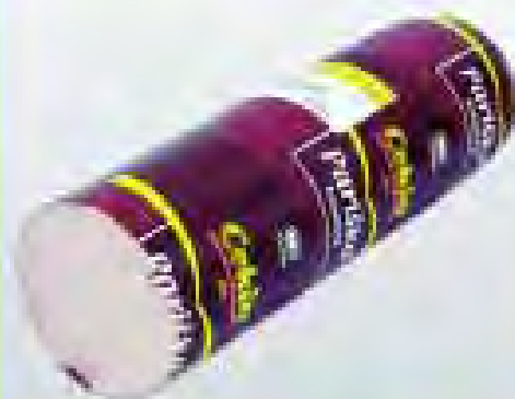
Pariška kobasica 1kg