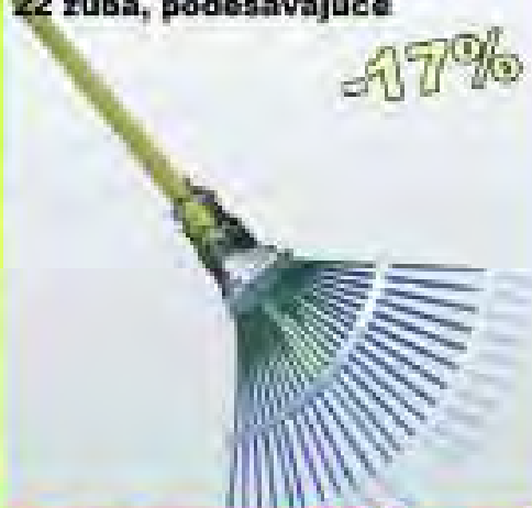
Grablje za lišće sa drškom, 22 zuba, podešavajuće