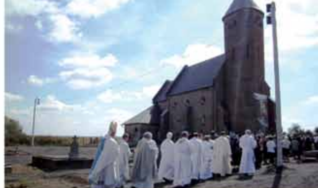
MOROVIĆ - SVETIŠTE SVIH KRŠĆANA