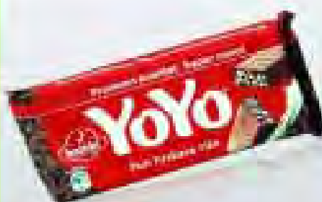
YO YO sa rižom 80g