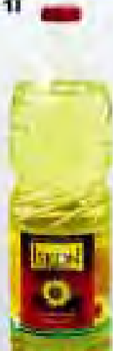
Ulje Iskon 1l