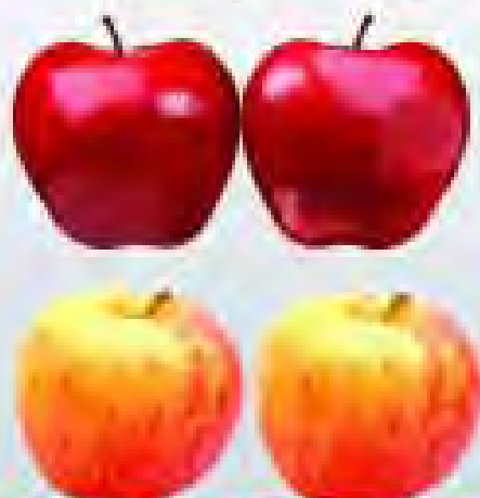
Jabuka gloster, elstar 1kg