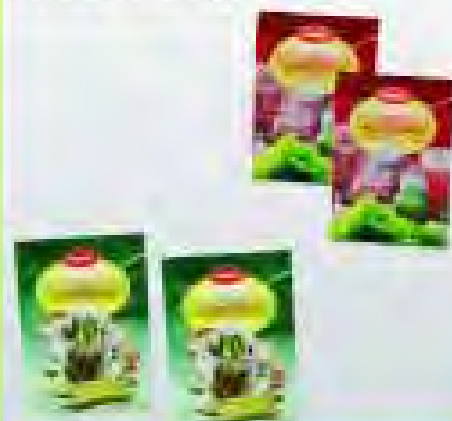
Vinobran 10g, Konzervans 5g