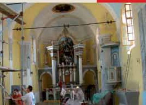
GIBARAČKA CRKVA U NOVOM RUHU

Subotica, 9. rujna 2011. Cijena 50 dinara