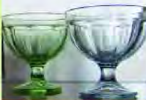
Čaše za voćnu salatu ili sladoled