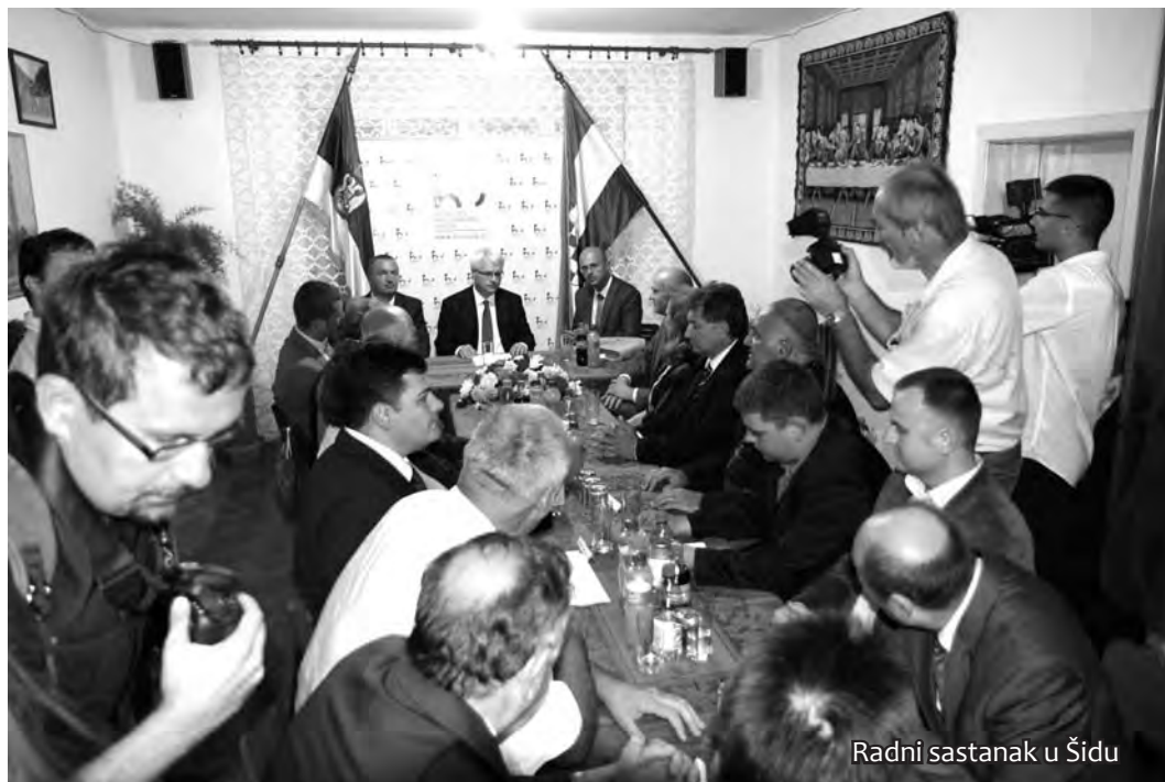
Radni sastanak u Šidu

i onda uputiti zahtjeve nadležnim tužiteljstvima budući da oni znaju konkretna imena i prezimena. Ukoliko se čak i ne dođe do pokretanja kaznenog postupka mi ćemo nastojati da naš dio posla, prije svega iz pijeteta prema tim ljudima koji su sve to prošli, ostvarimo. Nešto od toga će zasigurno biti procesuirano, vjerojatno neće biti sve, ali je tu onda lopta na tužiteljstvu.«