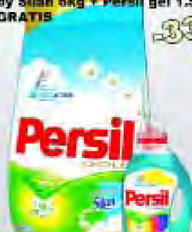
Deterdžent za rublje Persil Fresh by Silan 6kg + Persil gel 1.5L GRATIS