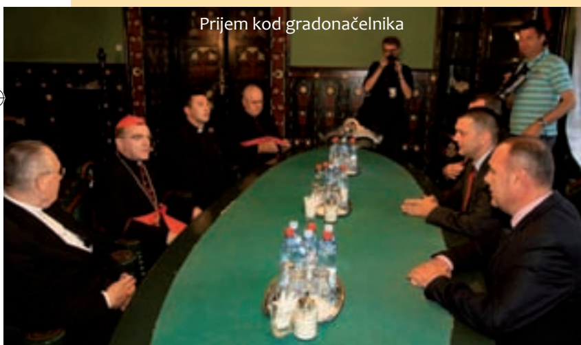
Prijem kod gradonačelnika