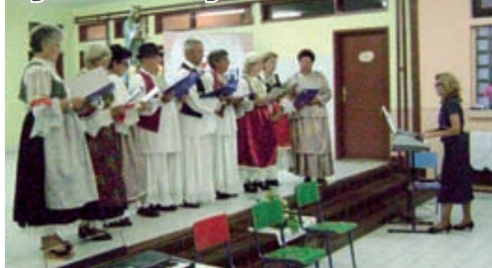
Mješovita pjevačka skupina HKPU »Zora« iz Vajske

U okviru koncerta upriličena je izložba u »Matoševoj« knjižnici na kojoj su postavljeni kipovi Majke Božje, krunice i stare fotografije vezane uz običaj gosponoša. Ovaj je postav priredio »Matošev« povijesno-istraživački odjel, a krunice su se zgodno uklopile na riječi vlč. Josipa Štefkovića, koji je na pri-