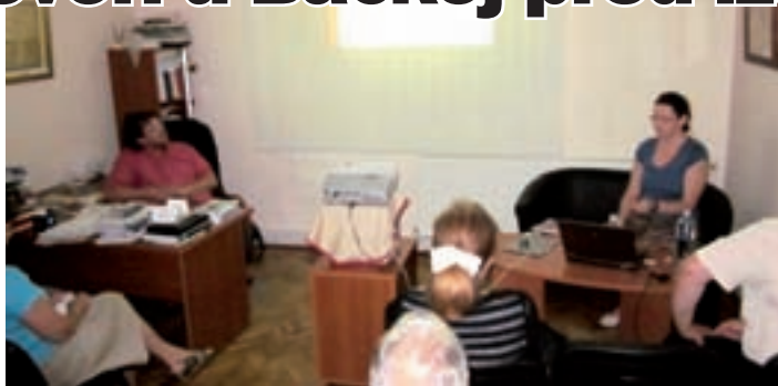
Ove govore danas čuvaju samo još stari naraštaji, dok mladi u najvećoj mjeri govore standardnim srpskim jezikom, čulo se na znanstvenom kolokviju

»Ti govori su značajni jer čuvaju dijelom staru akcentuaciju i dijelom staru sklonidbu. Značajni su kao dio hrvatskog jezika, ali i za rekonstrukciju nekakvih starih stanja u praslavenskom jeziku. Ovi govori brzo