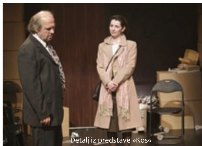
Detalj iz predstave »Kos«

Harrower zapravo bavi ostaci su života zauvijek obilježeni s jedne strane socijalno neprihvatljivim činom, a s druge, osobnom tragedijom prisilnog završetka jedne ljubavne veze. Predstava dakle govori o ispitivanju granica slobode, ali još više o ispitivanju granica