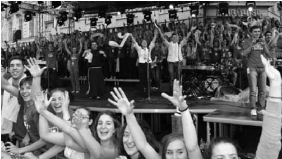
Na Trgu Bana Jelačića – tridesetak tisuća mladih

Papa je potom izrekao posebne pozdrave slovenskim, srpskim, makedonskim, albanskim i njemačkim vjernicima na njihovim materinim jezicima.