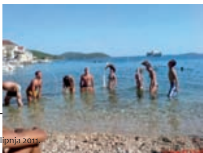
10. lipnja 2011.

I ove godine duhovna obnova i ljetovanje na Prviću