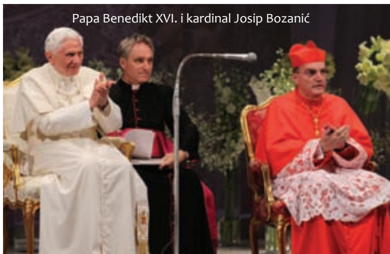
Papa Benedikt XVI. i kardinal Josip Bozanić

Papa se nakon toga susreo u Hrvatskome narodnom kazalištu s predstavnicima političkog, znanstvenog, kulturnog, gospodarskog, sportskog i estradnog područja, diplomatskog zbora, civilnog društva, te s poglavarima vjerskih zajednica. Među više od 700 uzvanika bio je najviši državni vrh, predsjednici: Josipović, Kosor i Bebić, te srpskopравoslavni mitropolit zagrebačko-ljubljanski g. Jovan Pavlović , glavni rabin u Hrvatskoj Luciano Moše Prelević , vrhovni islamski pogla-