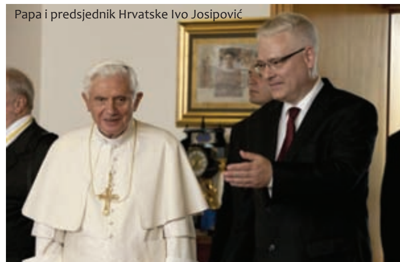
Papa i predsjednik Hrvatske Ivo Josipović

Nakon govora Papa se s pratnjom, pozdravljen putem vjernicima na zagrebačkim ulicama, zaputio na Pantovčak, gdje ga je dočekaio domaćin, predsjednik Josipović. Razgovarali su nasa-