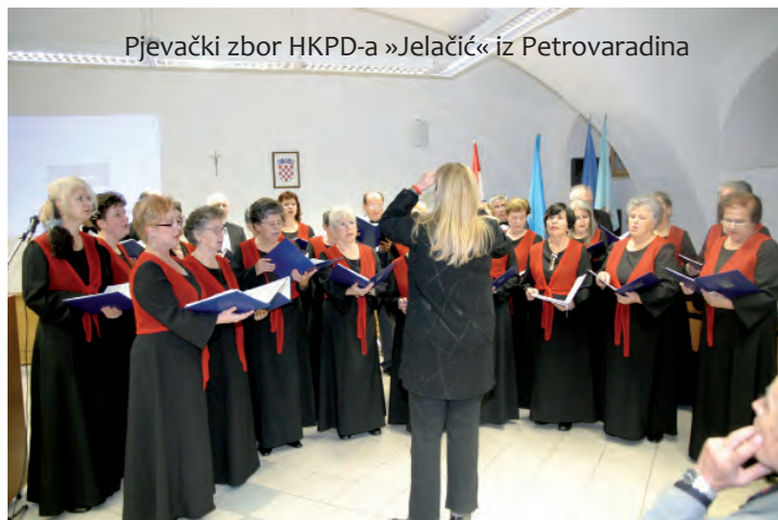
Pjevački zbor HKPD-a »Jelačić« iz Petrovaradina