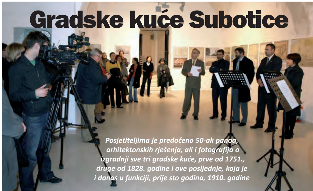
Posjetiteljima je predloženo 50-ak panoa, arhitektonskih rješenja, ali i fotografija o izgradnji sve tri gradske kuće, prve od 1751., druge od 1828. godine i ove posljednje, koja je i danas u funkciji, prije sto godina, 1910. godine

U uvodnoj je riječi ravnatelj Državnog arhiva u Osijeku prof. dr. Stjepan Sršan naglasio dugotrajnu suradnju sa Suboticom na svim poljima, i baš je zato ova izložba prva u nizu manifestacija u obilježavanju Dana grada, ali je želio naglasiti i činjenicu da je i Osijek, nakon proglašenja slobodnim i kraljevskim gradom, izradio projekt izgradnje vijećnice i donio odluku o lokaciji, a cijeli je kompleks nazvan vijećničkim trgom, no tada su došli novi prioriteti - vodovod, kana-