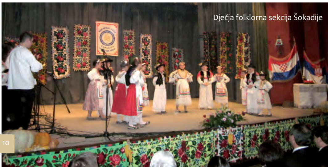
Dječja folklorna sekcija Šokadije