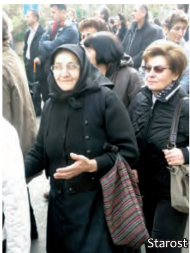
Starost i mladost

Nakon tolikih godina Vukovar je još uvijek simbol, ali ovoga puta – stalnog i mukotrpnog nastojanja da se obnovi porušeno, započne suživot, povrati izgubljeni sjaj, zaliječe rane, napokon pokopaju mrtvi i s nadom krene u budućnost. Ove fotografije pokušavaju predočiti tu dihotomiju vukovarske svagdašnjice, koje u konačnici ipak čine kontrapunkte (suprotnosti) životne skladnosti.