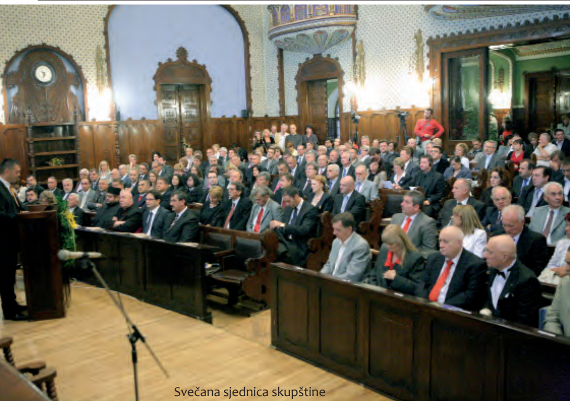
Svečana sjednica skupštine

Frankfurtu, koja će uložiti preko 11 milijuna eura i otvoriti 500 radnih mjesta, što je najveća green-fild investicija u posljednja dva desetljeća. »Na taj način Subotica dobiva najbolju potvrdu da je u stanju svojim snagama i uz potporu republičkih i pokrajinskih vlasti kreirati jednu novu gospodarsku mapu i novu gospodarsku sliku koja će nam nadomjestiti nestanak one slike iz 90-tih godina«, rekao je Vučinić.