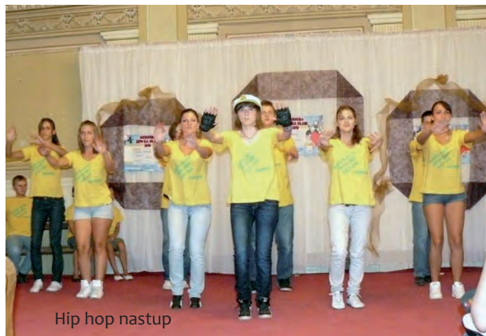
Hip hop nastup

vili smo projekt ove multinacionalne večeri. Grad je zdušno podržao ideju, imali smo fantastičnu suradnju, a mladi su bili nenadmašni u realizaciji. To je očiti dokaz kako je potrebno imati malo više povjerenja u mladost i samo joj dopustiti da se razmaše i nesmetano iskaže svoje kvalitete. U programu su sudjelovali učenici koji nastupaju na raznim natjecanjima, kako na