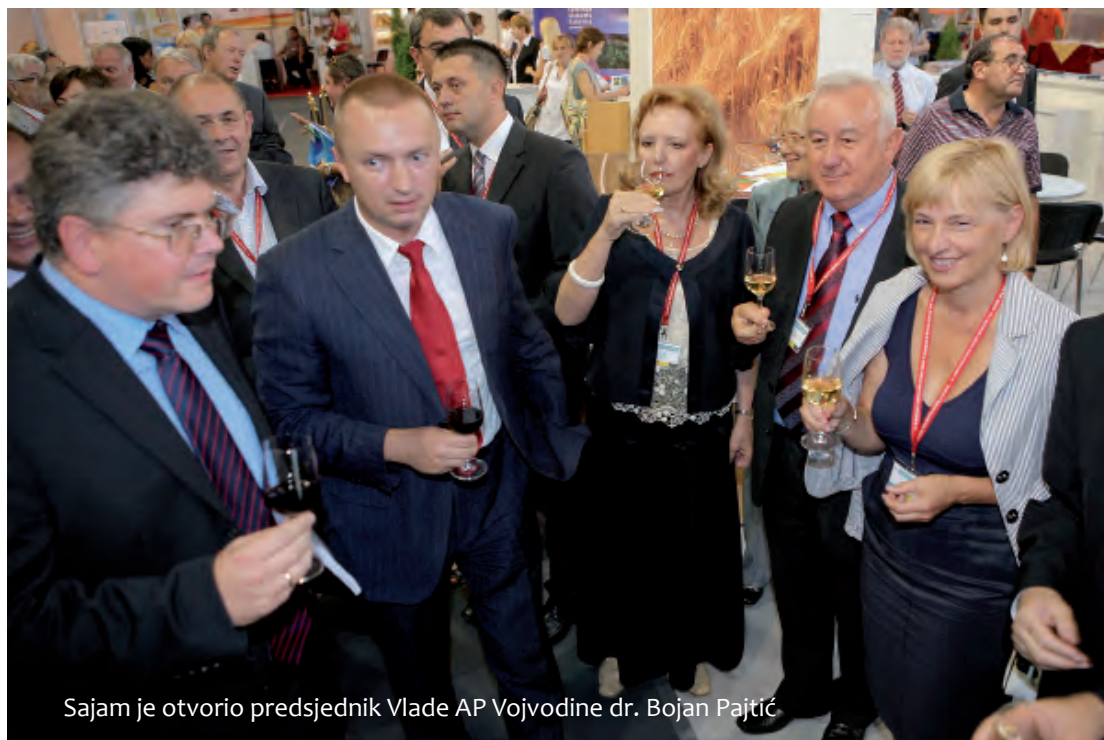
Sajam je otvorio predsjednik Vlade AP Vojvodine dr. Bojan Pajtić

Hrvatske tvrtke prvi put su se organizirano predstavile na ovom sajmu, a broj izlagača iz Mađarske udvostručen u odnosu na prošlu godinu