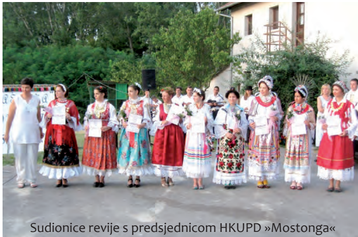
Sudionice revije s predsjednicom HKUPD »Mostonga«

U Baču je u petak, 27. kolovoza, treći put zaredom održan »Susret Šokadije«. Organizator je bio HKUPD »Mostonga« iz Bača, a priredba je dio manifestacije »Šokci i baština«, zajedničkoga projekta institu-