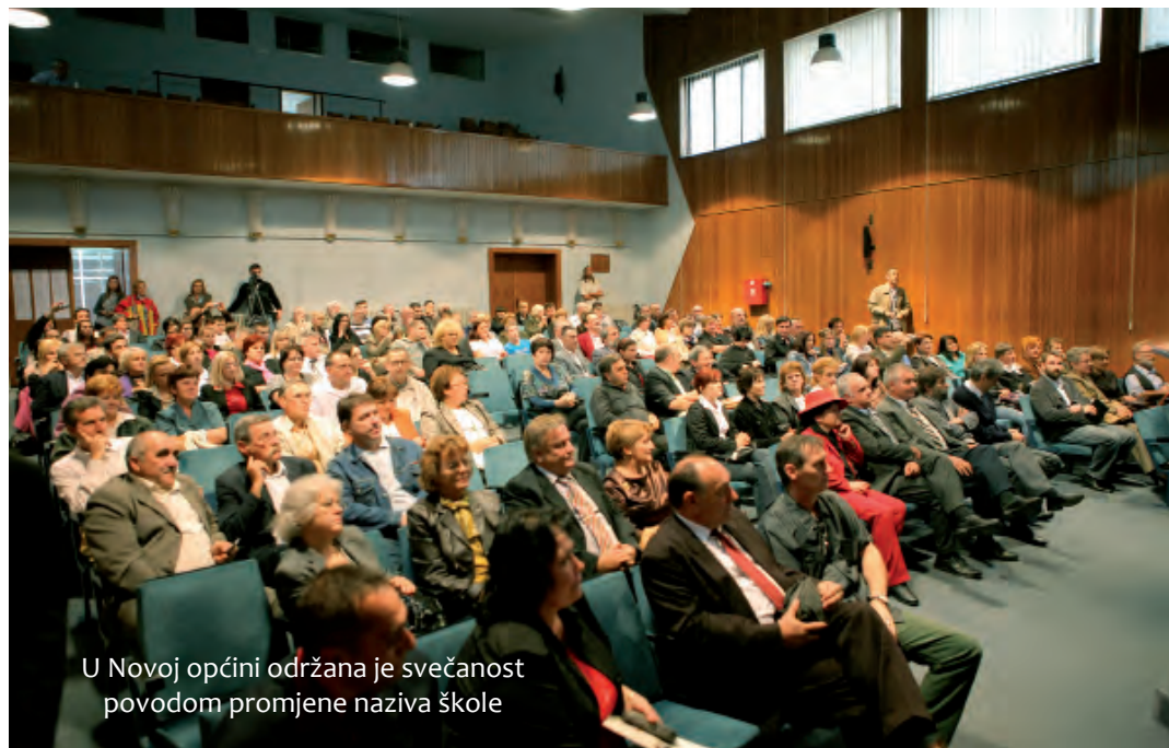
U Novoj općini održana je svečanost povodom promjene naziva škole