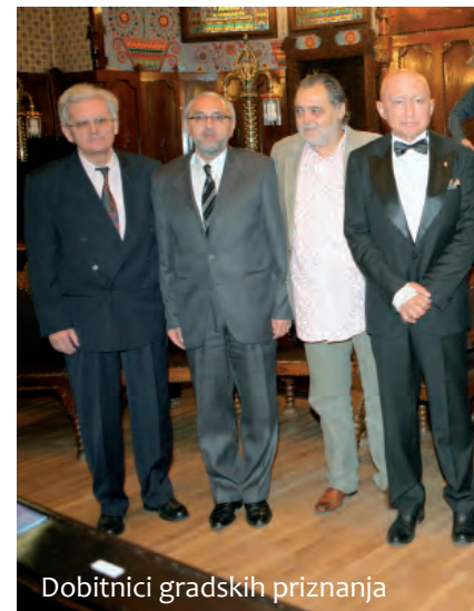
Dobitnici gradskih priznanja

On je najavio kako će poslije svečane sjednice biti potpisan memorandum o razumijevanju s Norma Grupom sa sjedištem u