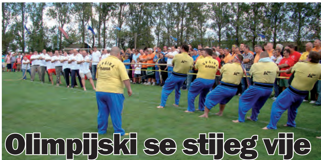
Manifestacija okuplja više od tisuće sudionika iz 10 hrvatskih županija, te susjednih država, Mađarske i Srbije