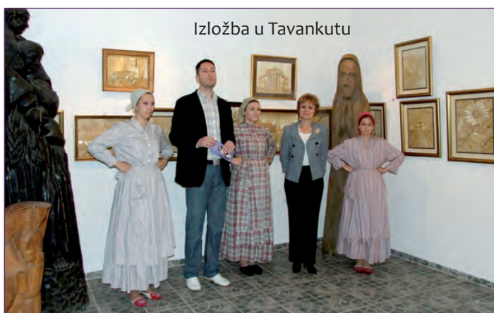
Izložba u Tavankutu

slika u tehnici aqual emajla, auto sprejeva, uljnih flomastera. Kako sam kaže, oni su nastavak multimedijalnog »rada u nastajanju« koji se bavi »promjenom motorike tijela i neurokinetike posjetitelja«. Nakon