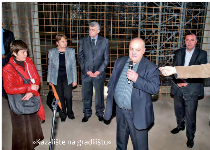
»Kazalište na gradilištu«

Ekskluzivno za potrebe »Noći muzeja« za građanke i građane otvoreno je gradilište na kojem niče buduća nova zgrada Narodnog kazališta. Na toj lokaciji prikazan je višemedijski projekt »Kazalište na gradilištu« u okviru kojeg su posjetitelji, a uz pratnju stručnjaka, mogli upoznati projekt rekonstrukcije zgrade. Prateću izložbu fotografija Augustina Jurige na temu izgradnje kazališta otvorio