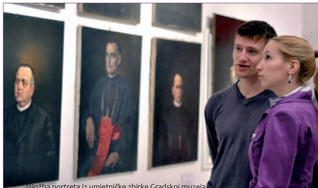
Izložba portreta iz umjetničke zbirke Gradske muzeja

lovati u radionici za izradu nakita od slame, nakon čega je upriličena retrospektivna izložba slika od slame, nastalih u razdoblju od 1986. do 2009. godine, odnosno tijekom protekla 24 saziva Kolonije