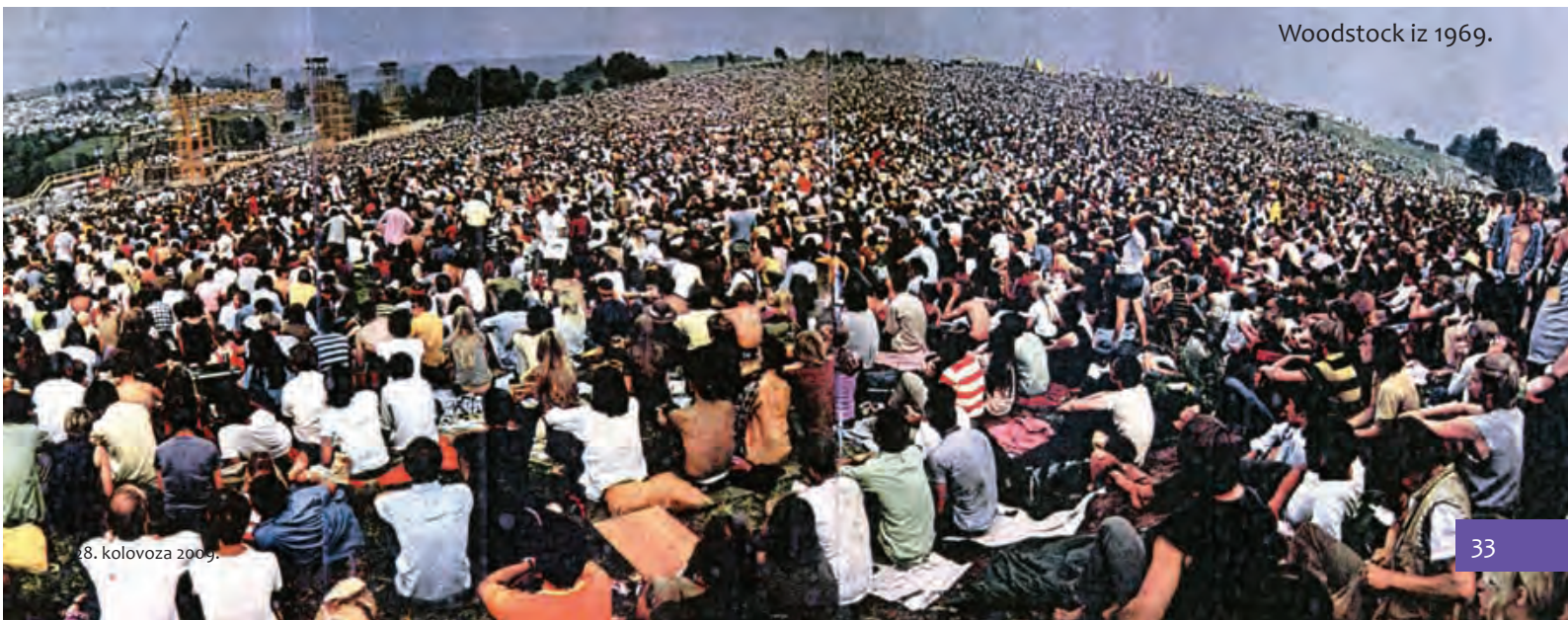
Woodstock iz 1969.