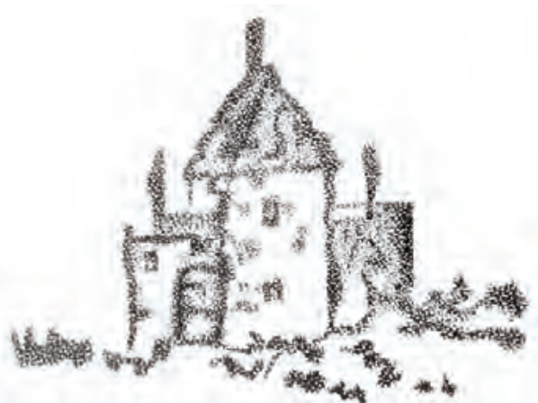
Crtež tvrđave s Laziusove karte 1570. godine