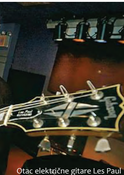
Otac električne gitare Les Paul

Premda su U2 već više od dva desetljeća globalni sinonim za politički aktivizam, humanizam te međureligijsku i međunacionalnu toleranciju kao bitan preduvjet mira u svijetu, oni dakako nisu svemoguć. Možda takav njihov politički angažman neće riješiti probleme svijeta, ali će nas sve potaknuti na razmišljanje i, nadajmo se, usvajanje ekumenskih i univerzalističkih stavova, kakvi krase Bona , Adama , Edgea i Larryja . Oni su i u Maksimiru pokazali kako vjera u Boga može nadilaziti vjerske, nacionalne i ostale razlike, kako križ i električna gitara mogu ujedinjavati a ne dijeliti ljude, a to je za gomilu mlade publike koja još uvijek formira svoje stavove o ljudima i svijetu više nego dragočena poruka. Hvala im na tome.