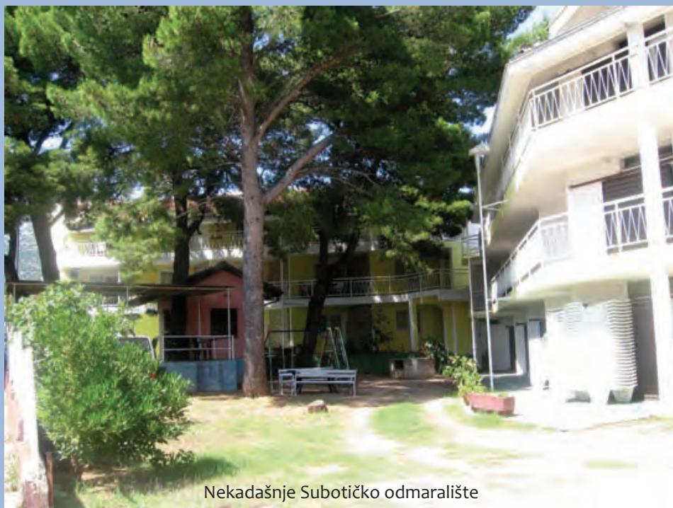
Nekadašnje Subotičko odmaralište

Za razliku od Subotičkog, obližnje Pančevačko odmaralište je zapušteno i devastirano, a čuvena terasa, tik uz more, obrasla je u korov.