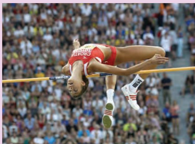
Blanka Vlašić: Svjetska prvakinja u skoku u vis Može li tko više?

Nakon posljednjeg vikenda ovih ljetnih školskih ferija, slijedi »najgori dan« u životu svakoga srednjoškolca. Dan početka nove školske godine. I kraja bezbrižnog provođenja slobodnog vremena obilježenog kasnim noćnim izostancima, još kasnijim buđenjima u danima izobilja zabave. Jer, počevši od prvoga rujna slijedi »novi raspored sati« u kojemu će »slobode« biti znatno manje, a za »zabavu« će biti zaduženi njihovi nastavnici i profesori.