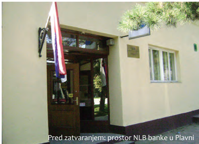
Pred zatvaranjem: prostor NLB banke u Plavni

Ovo je još jedna od posljedica privatizacije i mjera štednje i racionalizacije, kojima poslodavci štite svoje interese zaboravljajući humanu stranu života i potrebe drugih ljudi. Banka je u Plavni otvorena prije dvadesetak godina u potpuno novoj i opremljenoj prostoriji u samom središtu sela. Svo ovo vrijeme u njoj je radila jedna djelatnica obavljajući korektno sve bankarske poslove, a broj se klijenata sve više povećavao. Ovih će im dana stići obavijest o ovoj odluci i o mogućnosti daljnje suradnje s ovom bankom ili pre-