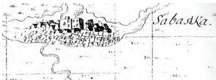
Veduta grada – crtež perom iz 1697. godine