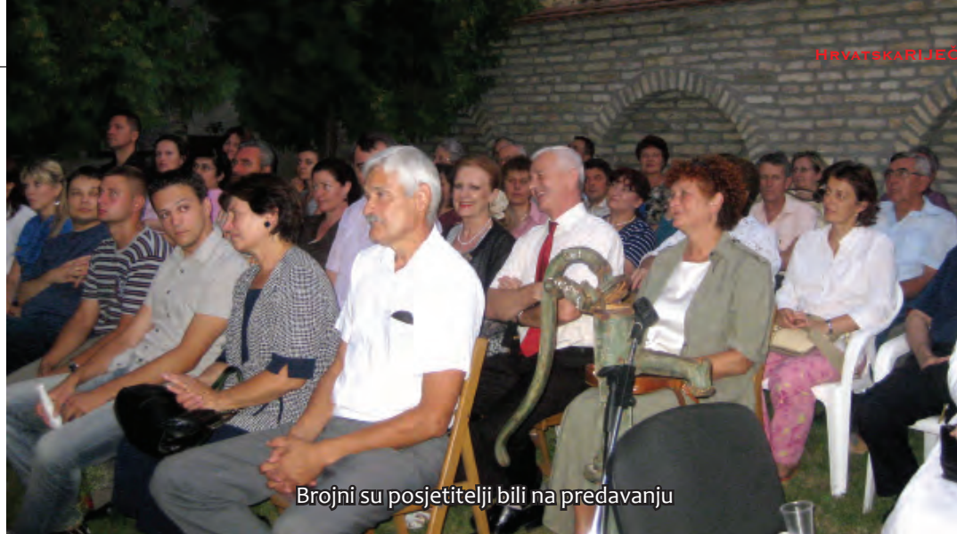
Brojni su posjetitelji bili na predavanju

Ovaj običaj »dogovor ili rukovanje« je zapravo dogovor o zarukama i o snašinom mirazu. Činjenica je da se zadržao do danas, ali samo