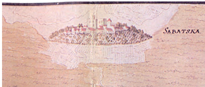
Veduta grada – akvarel 1697. godina