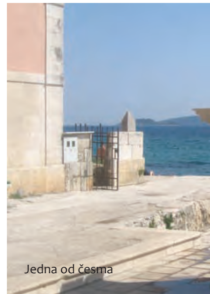
Jedna od česma