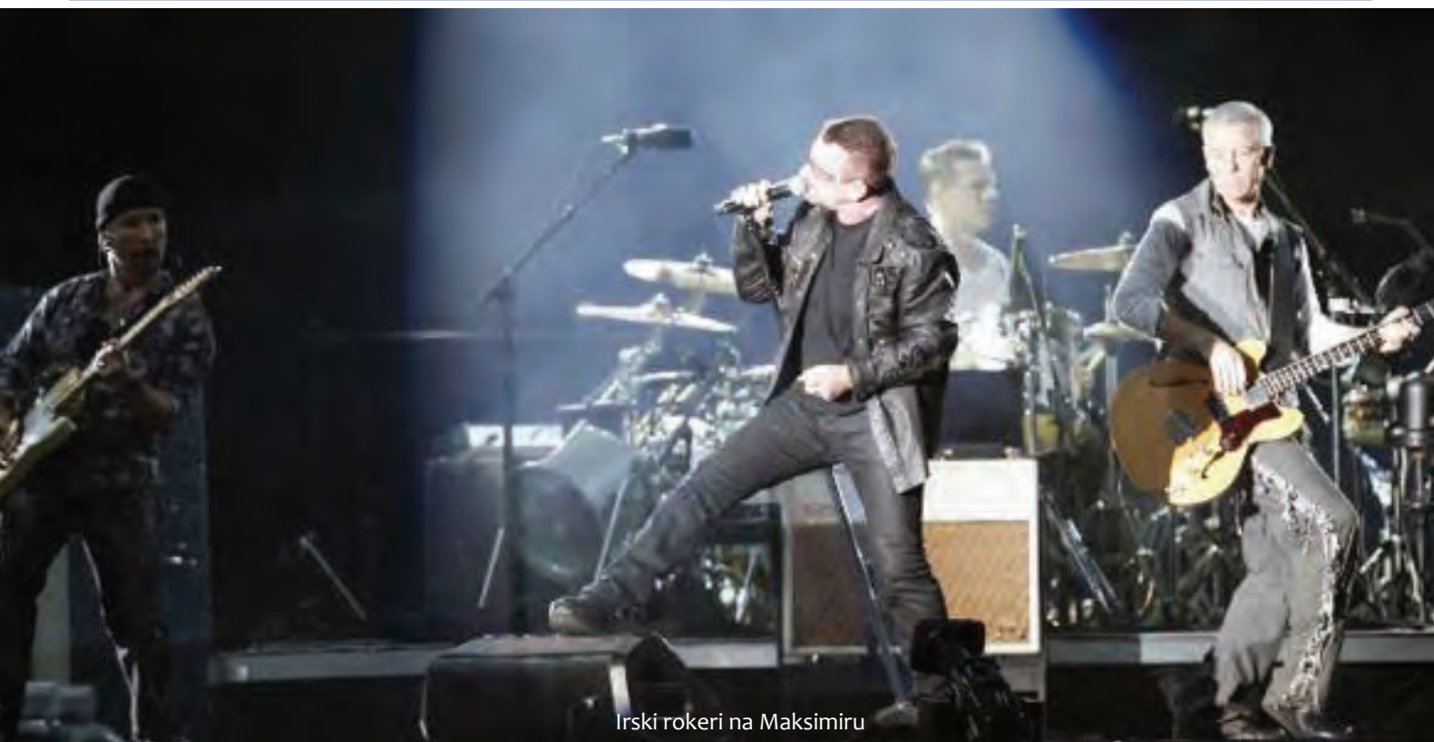
Irski rokeri na Maksimiru