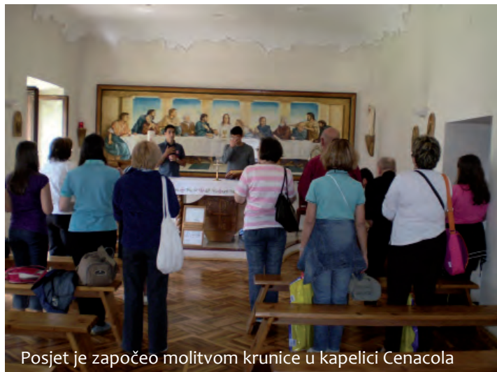
Posjet je započeo molitvom krunice u kapelici Cenacola

cu, poslije četrnaest godina droge i laži, nisam znao što je istina. Poznavao sam samo svoje interese, proračune, svoju korist. Govorio bih drugima ono što bi htjeli čuti. Istina u meni je bila mrtva. Nije više bilo života u meni. Kasnije, polako sam se suočio sa istinom. Pomogli su mi momci koji su me iskreno prihvatili govoreći mi