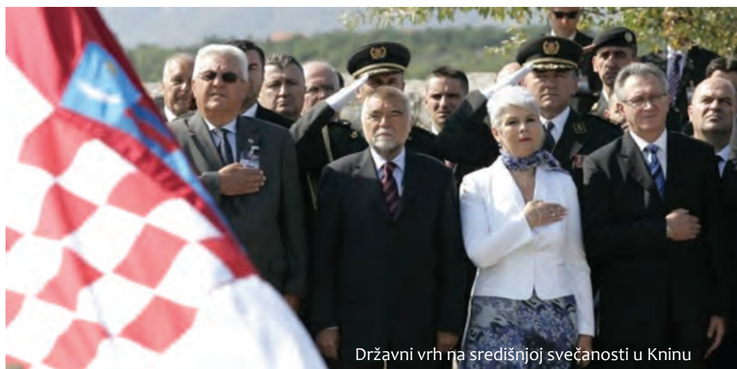
Državni vrh na središnjoj svečanosti u Kninu

Hrvatska je ove godine Dan pobjede i domovinske zahvalnosti i 14. godišnjicu Oluje prvi put slavila kao punopravna članica NATO-a, u kojem hrvatski vojnici danas ravnopravno s vojnicima ostalih zemalja Saveza sudjeluju u mirovnim misijama diljem svijeta.