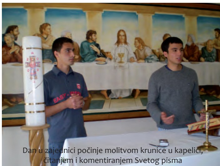
Dan u zajednici počinje molitvom krunice u kapelici, čitanjem i komentiranjem Svetog pisma

Doista je bilo potresno slušati te mlade ljude koji su vrlo rano upali u ponor ovisnosti i koji su tog dana otvorili vrata svojih nimalo lijepih života i pričali kako su, mladi i puni života, krenuli u taj svijet puni neznanja. Govorili su o paklu u kojem su se našli, o svakodnevnim sudaranjima sa stvarnošću i poniranju u mračne dubine ovisnosti. Oni su svoju mladost zamijenili za gorki okus nemoći, dobrovoljno se odrekli slobode i najljepšeg od svih dobivenih darova – života i otišli u zatočeništvo ovisnosti i droge. Nisu se sramili govoriti o tome kakvi su bili i priznati da su pogriješili, otkrivajući nam vlastiti život kao primjer zla koje droga može učiniti. Poručili su nam: »Nemojte ući u taj svijet, zatvarati život u slijepoj ulici bez svjetla i nade, bit će vam žao. Uništiti ćete svoj život i svoju budućnost, a Bog je u sve nas položio puninu istinite