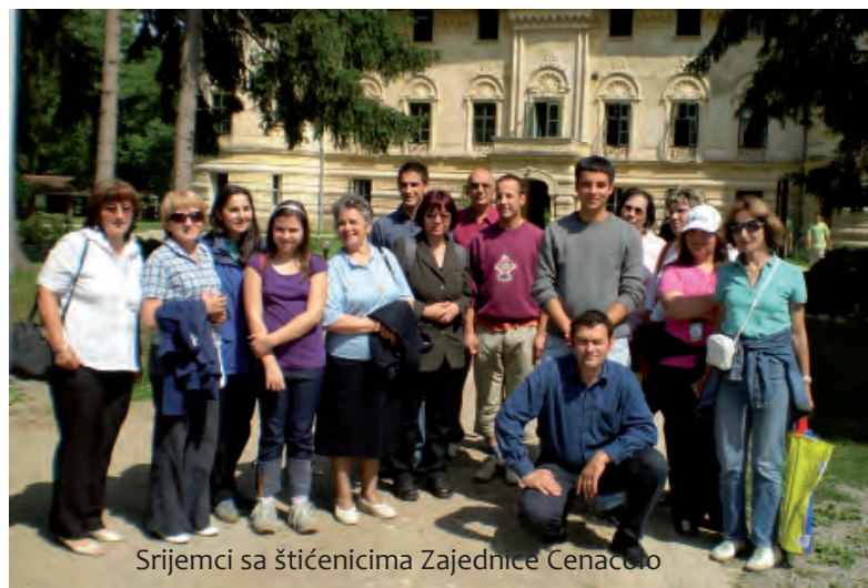
Srijemci sa štitičenicima Zajednice Cenacolo

Uz pomoć Ministarstva znanosti, obrazovanja i sporta i Ureda Grada Zagreba za zdravstvo, rad, socijalnu zaštitu i branitelje, zajednica svake godine obilježava Međunarodni mjesec borbe protiv