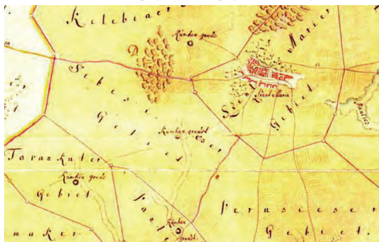
Ruševine šebešićke crkve ucrtane na Kaysserovoj karti iz 1747. godine

biskupija u svoju listu obveznika plaćanja crkvene desetine 1543. godine navodi i naselje Šebešić. Turski defter iz 1570. godine navodi posjed – pustaru Sebesegyhaz zajedno sa zemljama (oranicama) Vasarhel i Kelebe i s pijeskom Vasarhela i Kelebea, u blizini pustare Veresegyhaz. Tu se nalazi i majur Čauš efendije Hasana. Prikupljeni skromni iznos poreza od 250 akče plaćao se paušalno i izravno carskoj riznici. Ovo je u to doba izvjestan privilegij, jer lokalni turski činovnici nemaju prava ubirati nikakav eventualno dodatni porez. Kelebe možemo identificirati s Kelebijom, ali točno mjesto pustare Vašarhelja (Vašarišta) zasad nismo mogli identificirati.