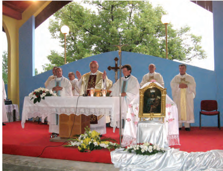
Misa na otvorenom u svetištu Gospe Tekijske