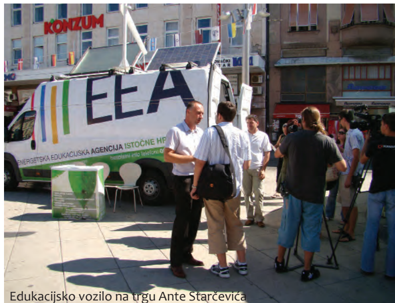
Edukacijsko vozilo na trgu Ante Starčevića

»Najprije treba kuću dovesti u red, pa naš jedan projekt i nosi takav naziv 'Dovesti kuću u red',