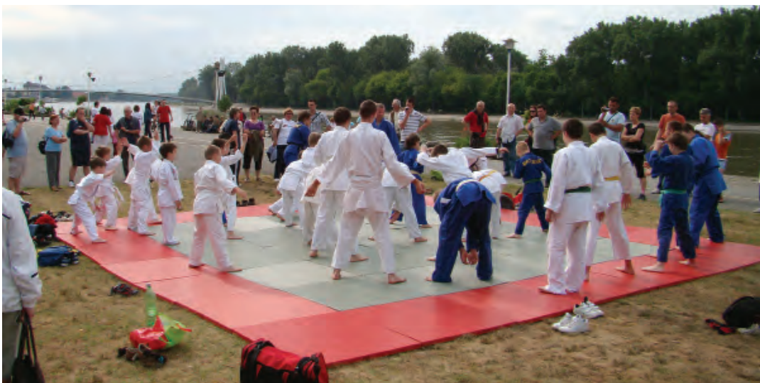
Sportske aktivnosti na obali Drave

noškolske i srednjoškolske mladeži, oko podneva plaha je proljetna kiša prekinula natjecanje u tenisu, ali nije u stonom tenisu u obližnjoj dvorani, bilo je tu nogometa, za muškarce i žene, rukometa, košarke, odbojke, šaha, streljaštva, pecanja, plivanja, veslanja, aerobika, juda i drugih bori-lackih sportova, ritmičke gimnastike, plesnih skupina, nordijskog hodanja i naravno obične, svakodnevne šetnje, pa je oko tisuću Osječana napravilo krug od Iktusa, preko mosta za Baranju, pored Copice, i preko pješakog mosta pod nazivom »Jedan krug za Osijek«.