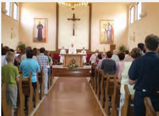
Sv. misa za Beščane održana je u crkvi blaženog Alojzija Stepinca u Virovitici