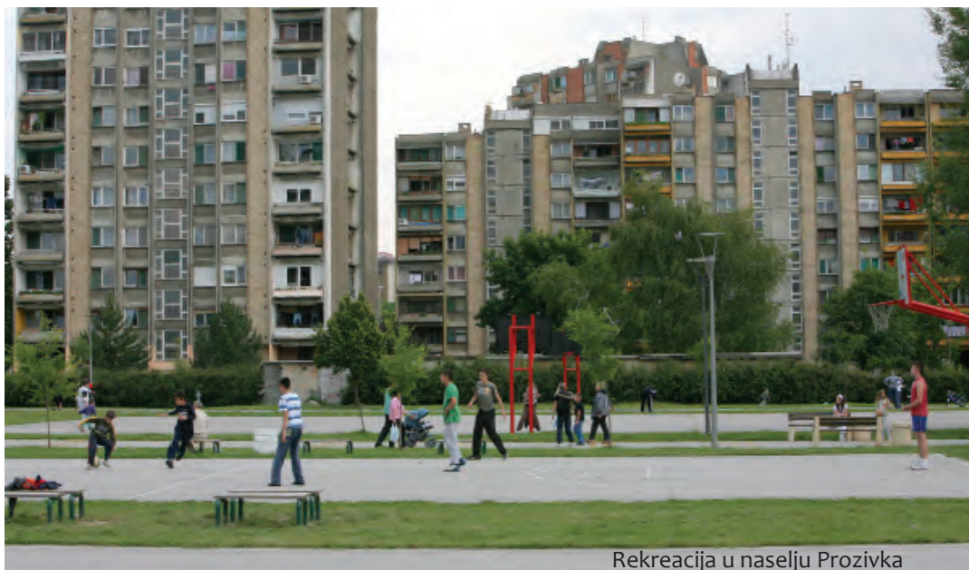
Rekreacija u naselju Proizvka

Osijek je dostojno obilježio Svjetski dan sporta, manifestaciju u koju je uključen od samoga početka i samo je prve godine nastupio van konkurencije, ali zato svih ovih godina bilježi zavidne rezultate, baš kao i gradovi partneri, najčešće su to bili izraelski gradovi, a prije koju godi-