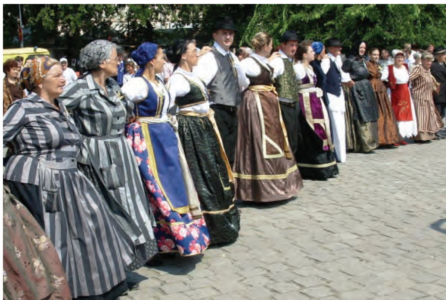
Dužionica 2008. u Somboru

Dužnosnici HNV-a razgovarali s predstavnicima hrvatskih ministarstava UDŽBENICI STIŽU, STIPENDIJA ZA SADA NEMA ..... 6