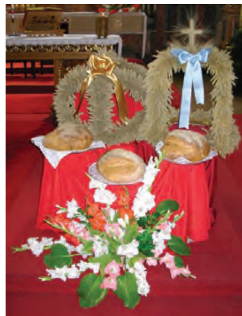
Koliko kruhova i koliko kruna će se nositi ove godine?

Stipan Pekanović je na sastanku rekao kako je kruna svega predaja vijenca predvoditelju svete mise u Subotici i da se i tamo treba pojaviti i UG »Bunjevačko