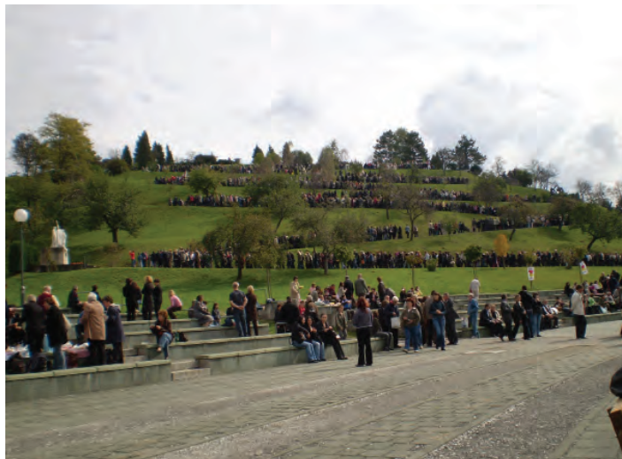
Hodočašće je završeno križnim putem pokraj crkve na otvorenom blaženog Alojzija Stepinca

M arija Bistrica, mjesto udaljeno pedesetak kilometara od glavnog grada Hrvatske, najveće je marijansko svetište u Republici Hrvatskoj. Budući da su katolici na ovim našim prostorima poznati po svojoj posebnoj odanosti Majci Božjoj, nazivajući je u svojim molitvama i pjesmama »majkom i kraljicom Hrvata«, to svetište Blažene Djevice Marije karakterizira velika masovnost te se svake godine u njega slijeva stotine tisuća ljudi u posebnom hodočasničkom zanosu. Tradicionalno posljednje subote u svibnju, oko 200 hodočasnika iz 29 srijemskih župa u zajedništvu s isto toliko srijemskih hodočasnika iz cijele Hrvatske, koji su devedesetih godina prošlog stoljeća prognani iz svog zavičaja, pohodilo je i ove godine, 30. svibnja, ovo naše najveće marijansko svetište. Organizator hodočašća je Srijemska biskupija, a organizaciju hrvatskog dijela srijemskih hodočasnika na sebe je preuzela Zajednica protjeranih Hrvata iz Srijema, Bačke i Banata.