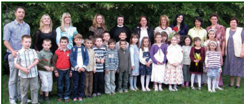
5. lipnja 2009. Budući prvaši s odgojiteljicama, časnom, tetama i nastavnikom engleskog jezika

Djeca, roditelji i odgojiteljice su u ponedjeljak, 1. lipnja, krenuli za Blato, gdje će boraviti sve do nedjelje.