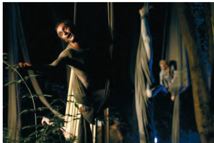
Akrobacije na svilenim platnima: iz predstave »Grižula«

Vremena za odmor, kako kaže, praktički nema, budući da, pokraj navedenih angažmana i studija, svoje lutkarsko znanje koristi snimajući političko-satirički serijal »VIP« za potrebe emisije crnogorske televizije »Vijesti«. A od jeseni