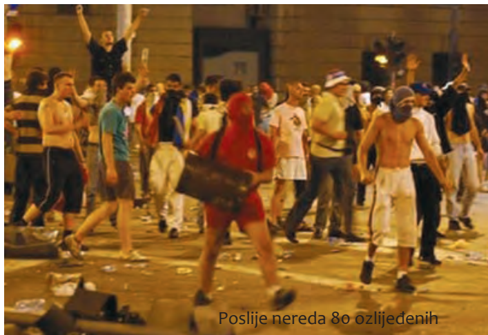
Poslije nereda 80 ozlijeđenih

I policija i građani očekivali su nereda koji su se i dogodili, ali nisu bili razmjera poput onih nakon proglašenja kosovske neovisno-