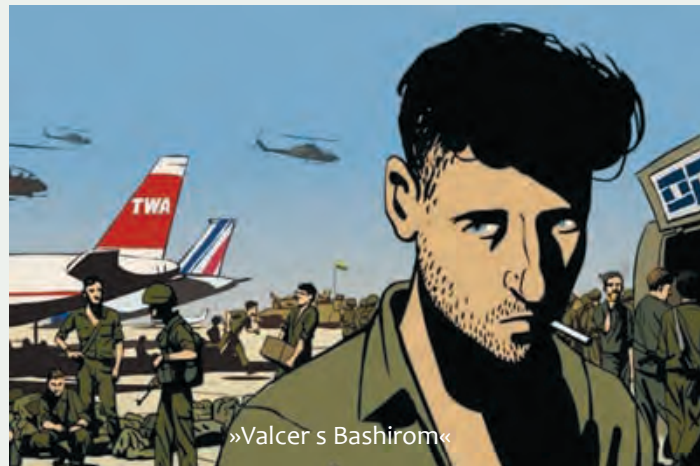
»Valcer s Bashirom«

Nagrada za toleranciju »Gorki List« dodijeljena je estonskom filmu »Manus« debitantkinje Kadri Kusar , za »hrabar pristup u istinitoj priči koja se protivi konvencijama tipične drame o odrastanju, kao i za vizualni koncept i