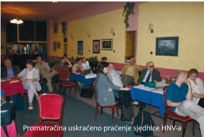
Promatračina uskraćeno praćenje sjednice HNV-a

S jedne strane sila, a s druge apsolutni nerad, bili su preduvjeti za sramotno vođenje sjednice HNV-a. Sjednica je bila potpuno nepripremljena. Niti jedna odluka koja je stavljena u dnevni red nije prošla propisanu proceduru u pripravi.