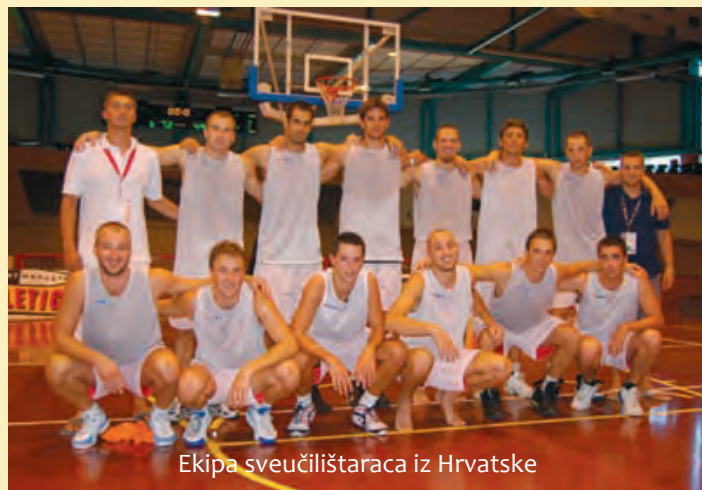
Ekipa sveučilištaraca iz Hrvatske

Poslije, u razigravanju, jednu su utakmicu dobili a jednu izgubili i na koncu osvojili 9. mjesto. U muškoj konkurenciji u finalu su se našli predstavnik Srbije (sveučilište BG) i predstavnik Litve. Litavci su na koncu slavili 97:70, te osvojili prvo mjesto. Treći su bili predstavnici Cipra, koji su pobijedili Španjolce. U ženskoj konkurenciji, zlato je pripalo Ruskinjama, srebro su osvojile predstavnice Poljske, dok je brončano odličje pripalo Srbiji (sveučilište BG). Posljednjeg dana prvenstva, poslije finalne utakmice u muškoj konkurenciji, upriličena je svečana dodjela odličja, te svečano zatvaranje osmog sveučilišnog europskog prvenstva u košarci.