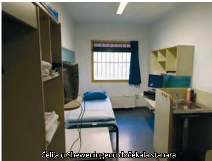
Ćelija u Sheweningenu dočekala stanara

Sve su srbijanske vlasti godinama uporno govorile kako »nemaju informacija« o Karadžiću, a onda se ispostavilo da se možda i sve vrijeme on nalazio njima pred nosom, u središtu Novog Beograda