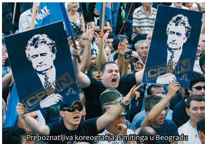
Prepoznatljiva koreografija s mitinga u Beogradu

ak tisuća prosvjednika, koji su od srbijanskih vlasti zahtijevali da se haški optuženik ne isporuči međunarodnom sudu.