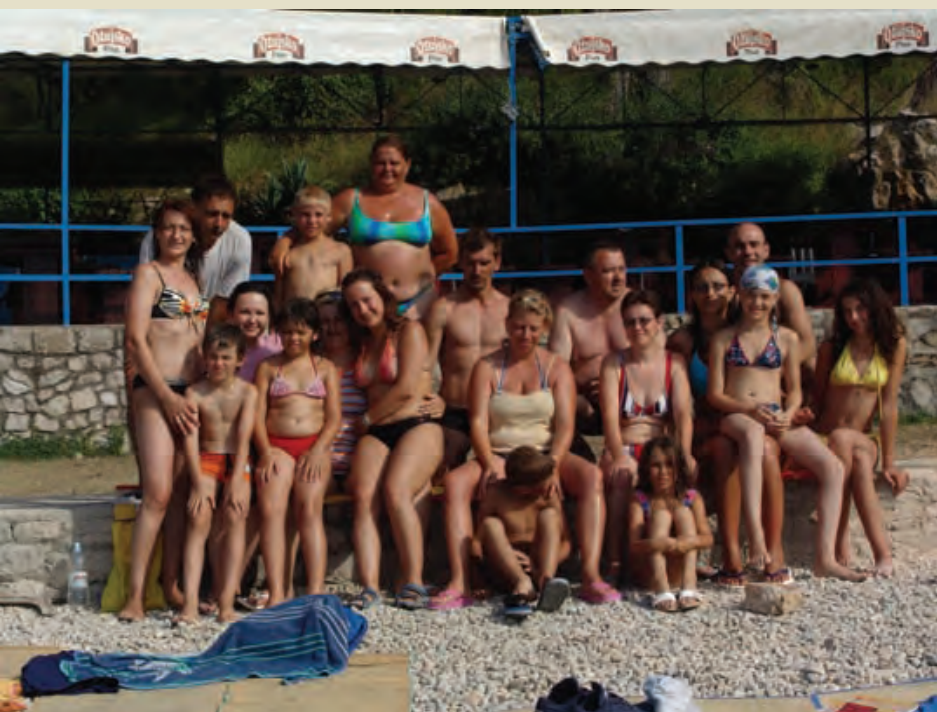
Djeca, roditelji, nastavnici svi skupa na ljetovanju na radost svima