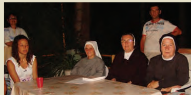
Časne sestre sv. Križa – Betanija