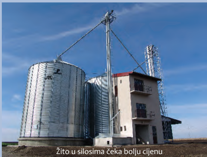
Žito u silosima čeka bolju cijenu

Otkazana sjednica HNV-a na kojoj je trebao biti izabran direktor NIU »Hrvatska riječ«