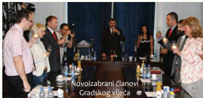
Novoizabrani članovi Gradskog vijeća