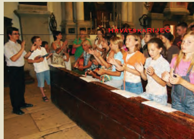
Djeca su svaki dan bila na misi