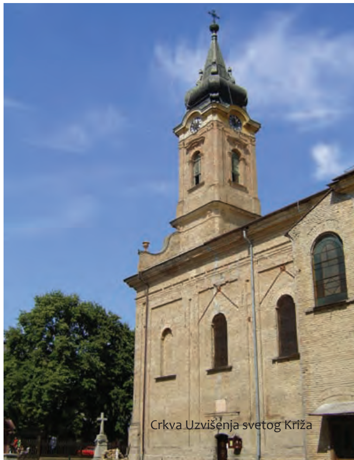
Crkva Uzvišenja svetog Križa