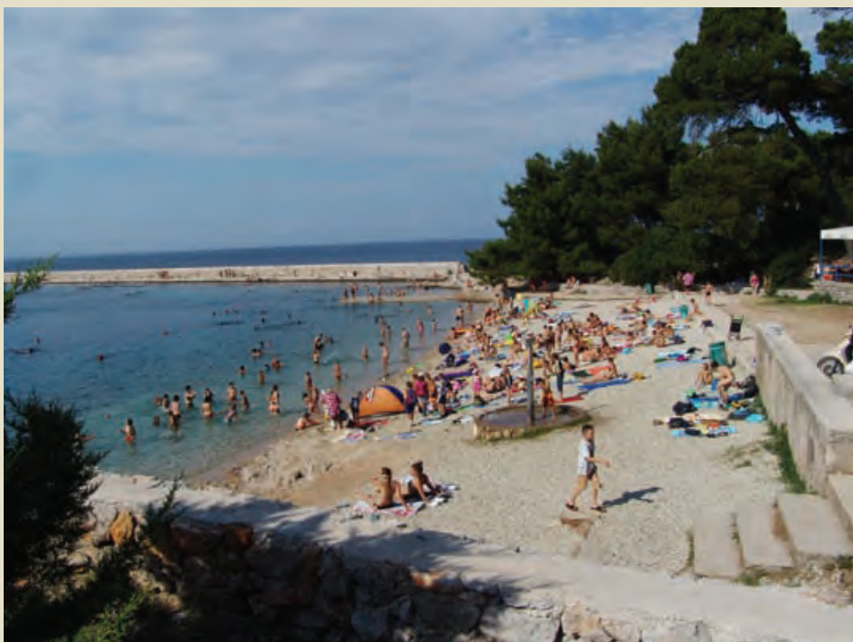
Plaža u Velom Lošinju na koju su svi rado išli