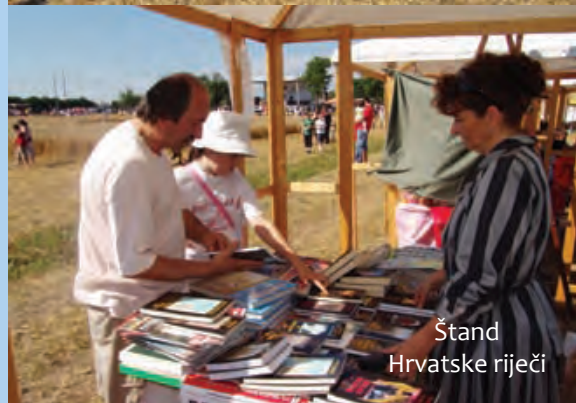
Štand Hrvatske riječi