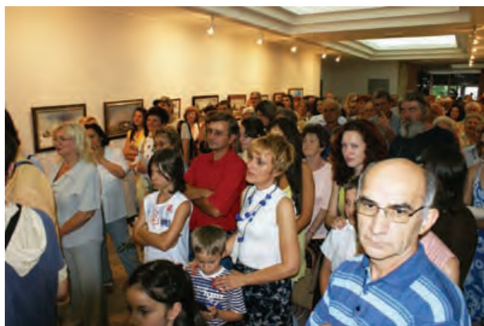
Otvorenje izložbe: Veliki broj posjetitelja