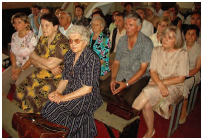
Pjesnici Lire naive