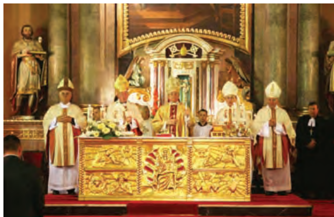
Svečano euharistijsko slavlje u subotičkoj katedrali

ZAJEDNIČKE INICIJATIVE: Na kraju mise nazočnima se obratio apostolski nuncij mons. Eugenio Sbarbaro . On je podsjetio