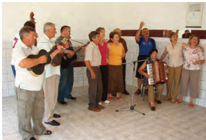
Susret tamburaša Šokadije i pjesnika Lire naive