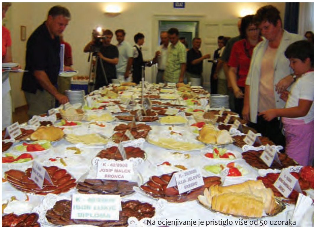
Na ocjenjivanje je pristiglo više od 50 uzoraka