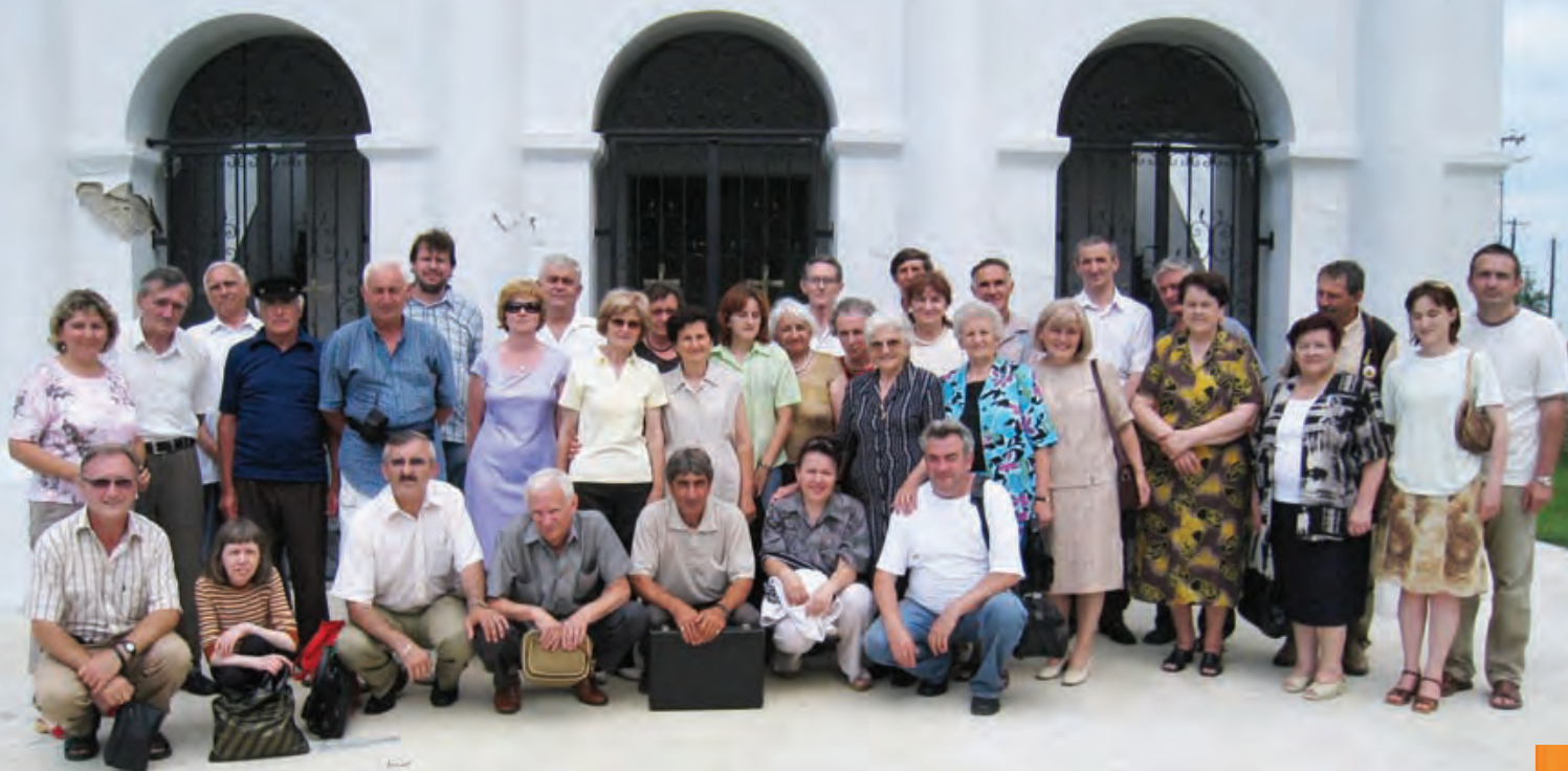
Lira naiva 2008. u Sonti