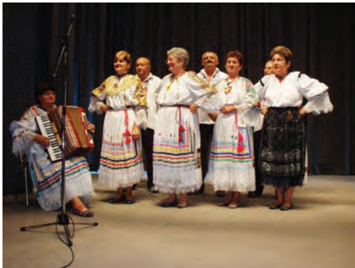
Pjevački zbor KPZH »Šokadija«

»Riječima da(va)ti život kroz pjesmu« vispreno je prezentirao Tomislav Žigmanov, uz neplanirani