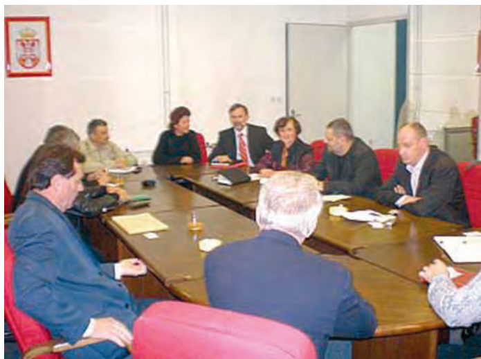
Najavljen i nastavak suradnje kulturnih institucija i djelatnika: sa sastanka u Rijeci

ske administracije, našim gospodarstvenicima ponuditi mogućnost suradnje s lukom Rijeka, koja je bliža Vojvodini u odnosu na luku Bar, s jedne strane, a s druge, luka