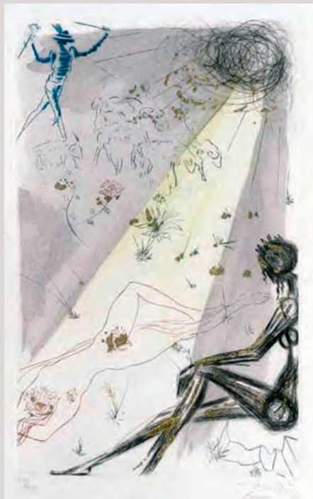
Jedan od Dalijevih grafičkih listova

Picasso, Miró i Dali našli su se u ovom komornom izložbenom prostoru zahvaljujući ravnatelju galerije Savi Stepanovu , koji je, saznajući za nekoliko primjeraka radova slikara u privatnim kolekcijama u Novom Sadu počeo tragati i za ostalim, mogućim, nakon čega su sami kolekcionari ponudili djela kako bi publika mogla uživati u ljepoti crteža ova tri velika umjetnika koji su tijekom 20. stoljeća stvorili opus koji je izmijenio povijest svjetskog slikarstva. Sama po sebi izložba nema koncepciju niti je treba tražiti, kaže Stepanov, dodajući kako