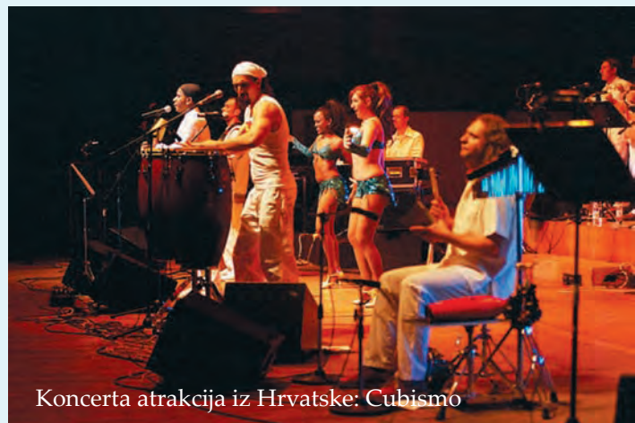
Koncertna atrakcija iz Hrvatske: Cubismo

Trenchtown od ove godine organizira Fondacija za omladinsku kulturu i stvaralaštvo »Fokus« iz Subotice ( http://www.fokus-su.org ), a ovogodišnji moto festivala je »Tolerancija