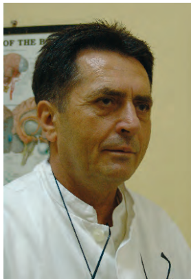
Piše: Dr. Franjo P. Petreš, neuropshijatar

P od riječju glavobolja opisuje se gotovo svaka vrsta bola koju osjećamo u glavi. Najčešće bol je lokaliziran u predjelu sljepoočnice i čela, mada nije rijetkost pojava bola u potiljačnom dijelu glave i u donjem dijelu lica.