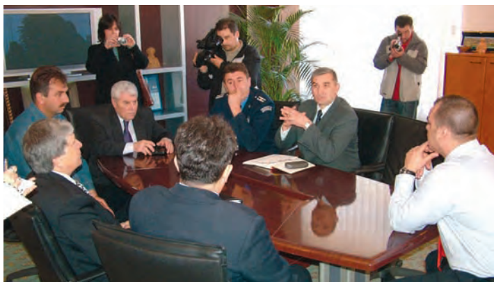
Sa sastanka: Srbija postaje moderna europska država u kojoj se poštivaju zakoni

Predsjednik Općine Ješić je podsjetio kako se, tijekom protekloga desetljeća, veliki broj Hrvata pod pritiskom iselio iz Novog i Starog Slankamena, zbog čega »pojedinci danas odgovaraju pred Haškim tribunalom«, te je uslijed toga drastično promijenjena i etnička slika Slankamena. On je ocijenio kako su međunarodni odnosi na uzlaznoj putanji, ali i da će se ovakve stvari vjerojatno događati i ubuduće, te