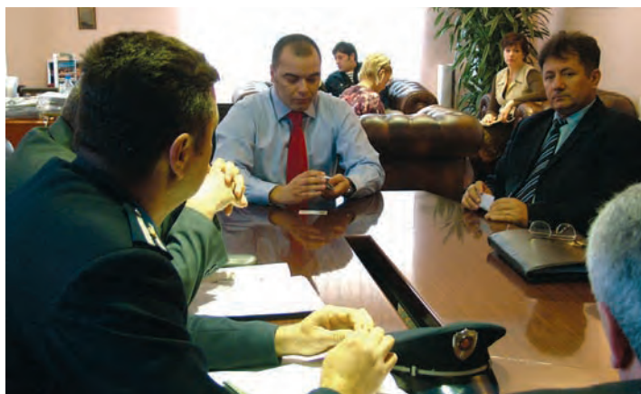
Nakon incidenta: uspostaviti će se policijska postaja u Novom Slankamenu