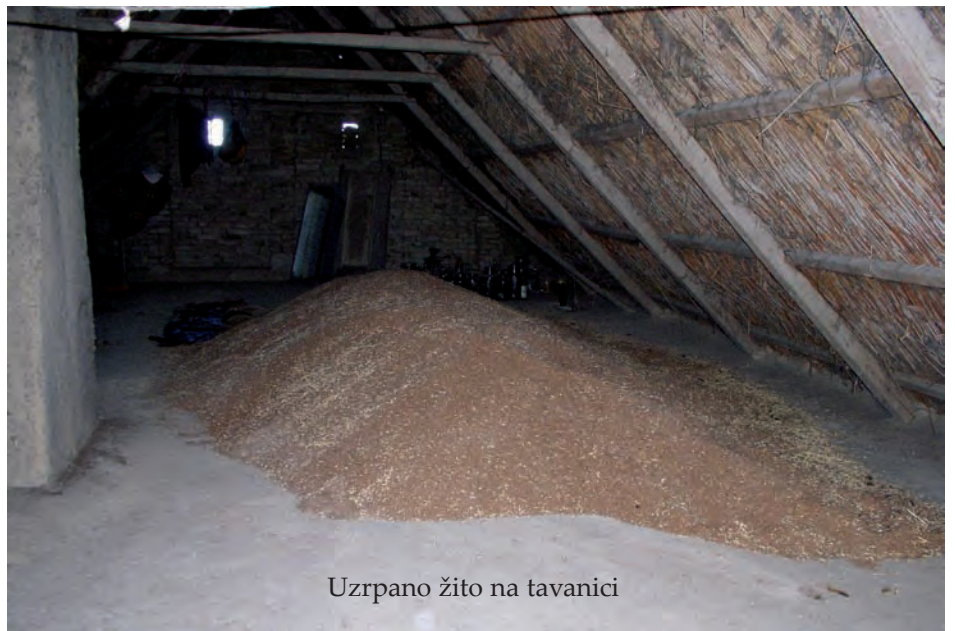
Uzrpano žito na tavanici

Za pokrov trskom rogove krova su popriko sastavili tanjim pajantama na 130-140 centi jednu od druge. Na rogove su poslagali osmucanu posnopicu trske i s likom (tanki sloj dračovog drveta izmed kore i debla) el pletenicom od rogoze (barska biljka) povezali je za gredice i rogove. Posnopica je snop trske debljine 50-60 centi. U Posnopicu su ukljukali i maljicom (napravom za nabijanje uzboja)