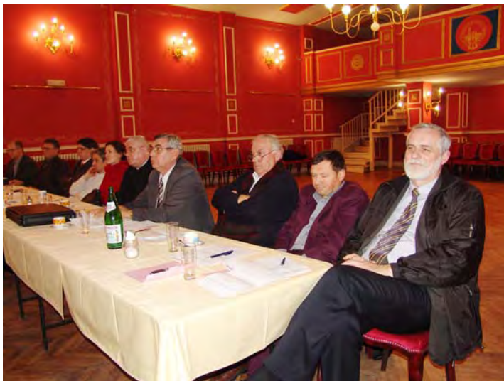
Duga rasprava o prijedlogu za izmjene i dopune Statuta

Zbog prekida sjednice na dnevni red nije dospjelo još šest planiranih točaka, među kojima su imenovanje člana Izbornog odbora HNV-a