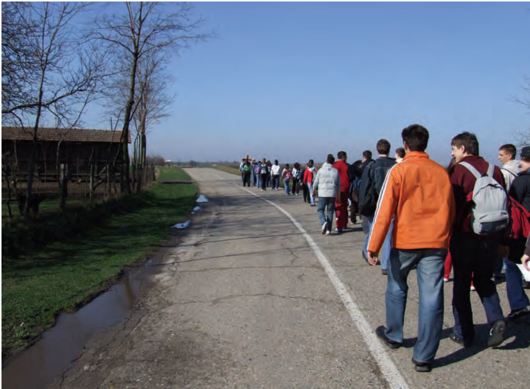
Mladi na križnome putu

SRCEM U KORIZMI: Zato kroz korizmu postimo ovako... UMOM: gdje ljubimo Gospodina Boga svoga svim srcem svojim, NJEGUJEMO Božju misao i njegovu dobrotu, ODBACUJUĆI ružne i zle misli prema događajima svoga života i svome bližnjemu, OČIMA GLEDAJUĆI svijet, stvari i osobe čistim i dobrim okom, IZBJEGAVAJUĆI nedobronamjerne poglede, UŠIMA SLUŠAJUĆI riječ Božju i slušajući brata koji Ti nešto traži ili se želi samo rasteretiti... , OTVORENOŠĆU slavljenja Boga u osobnoj molitvi, zajedničkoj u obitelji i župskoj zajednici, ODBACUJUĆI govoriti zlo o onome tko Ti je priuštio patnju... pokušati moliti za takvu osobu, ali oslanjajući se na Boga da će Ti On pomoći da možeš za nju moliti... SVLADAVAJUĆI SE u pušenju, piću, nekonstruktivnim filmovima i televiziji... POMAŽUĆI onome tko ti traži neku uslugu... ODBACUJUĆI ljenčarenje, gubljenje vremena na beskorisna brbljanja... SRCEM , pokazujući ljubav prema bližnjemu, započinjući od tvoje obitelji... Najprije voli i pokazuj ljubav osobi koja je pokraj Tebe.