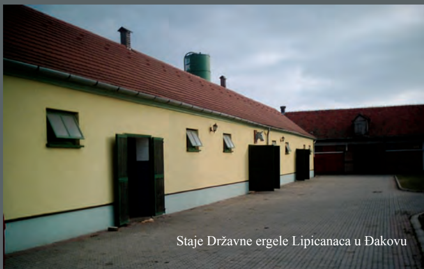
Staje Državne ergele Lipicanaca u Đakovu

podrijetla lipicanci potječu, kako im samo ime već kaže iz Lipika, a nastanak ove ergele datira još od prije 500 godina i možete samo zamisliti kolike su to godine tradicijskog rada s ovim plemenitim konjima, i generacijama rasnih životinja s najkvalitetnijim »papirima«, pojašnjava Gavrak i na moju molbu, ipak, pristaje izvesti jednog lipicanca po imenu Zenta.