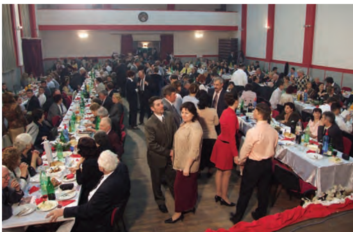
Oko tristo gostiju bilo je na prelu