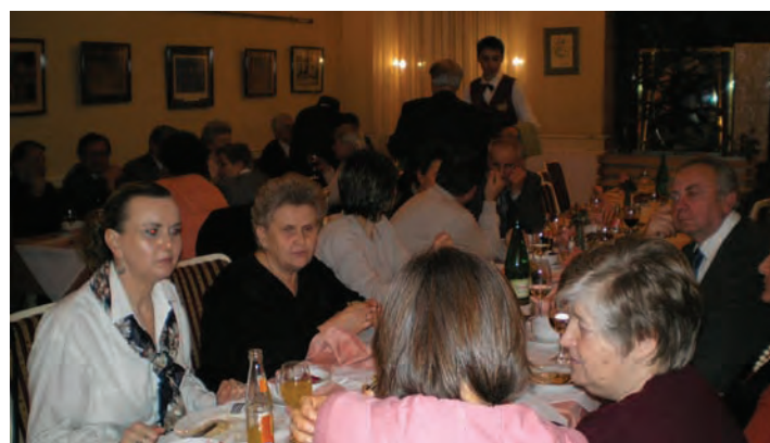
Zemunci su se okupili u zagrebačkoj gostionici »Frankopan«