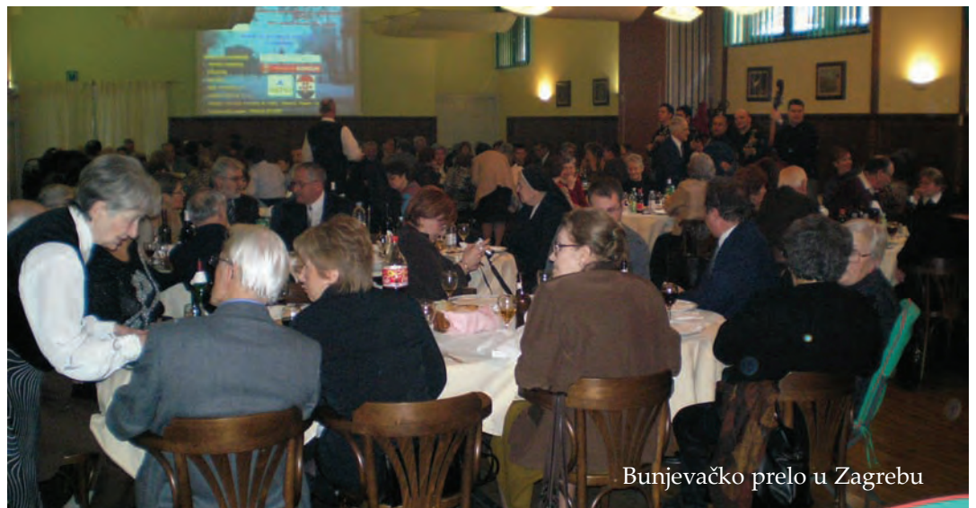
Bunjevačko prelo u Zagrebu