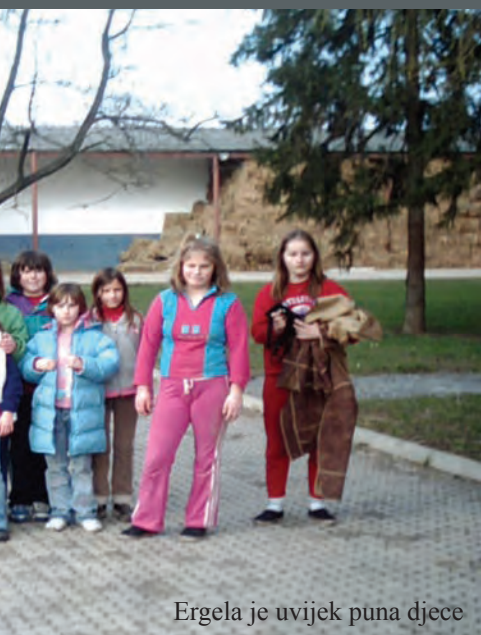
Ergela je uvijek puna djece

Na ergeli uvijek ima puno djece koja uživaju dijeliti vrijeme u društvu svojih ljubimaca, a postoji i sekcija tzv. terapeutskog jahanja za djecu i odrasle osobe s posebnim potrebama.