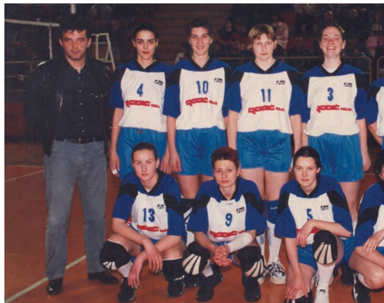
Sezona 1996./1997. ŽOK »Spartak I Finalisti Kupa Jugoslavije, četvrto plasirani u prvenstvu Jugo-

Odbojka me je oduvijek privlačila dinamičnošću i kolektivizmom potrebnim za pobjeđivanje protivnika na suprotnoj strani mreže, a možda je i ta mreža, koja sprječava tjelesni kontakt i neugodno podsjećanje na povredu iz mladosti, dodatno odlučila moj konačni izbor sporta. Moj konkretan odbojkaški angažman započinje negdje koncem šezdesetih godina prošloga vijeka, u vrijeme kada