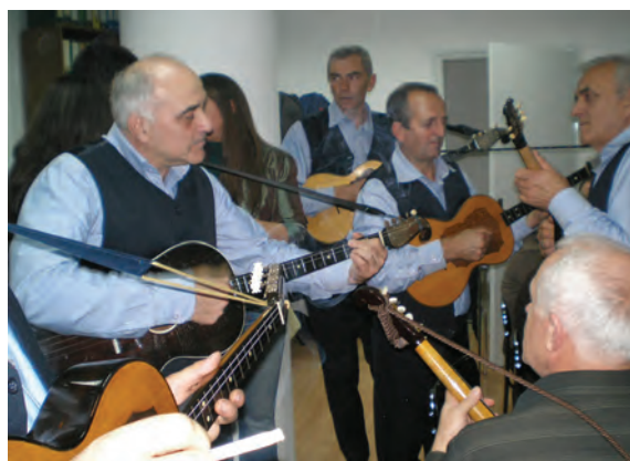
Tamburaški sastav iz golubinačkog HKPD »Tomislav«

Naselje Golubinci spominje se među deset sela u predstavi podnesenoj 1634. godine Sv. Stolici u Rim, povodom prelaska katolika u pravoslavlje. Godine 1702. zabilježeno je da Golubinčani imaju svoje vinograde u okolini, spominju se i 1713. godine, a 1733. se već navodi da u naselju živi 36 »glava jakih«, dok se godinu dana kasnije spominje da u selu ima 70 domova. Nema pouzdanih podataka o nastanku