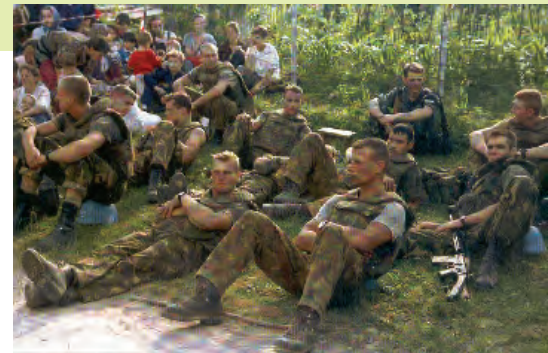
Suodgovorni za masakr u Srebrenici: Nizozemski vojnici s narodom

SREBRENICA: Godine 1995. srpska je vojska počinila težak zločin nad muslimanskim stanovništvom Srebrenice, grada u istočnoj Bosni. Informativna je misija francuske Nacionalne skupštine 2. prosinca 2001. godine priznala odgovornost francuskih časnika za taj pokolj. UNPROFOR-om je u to doba zapovijedao francuski general, a Francuska je davala najveći broj vojnika na tom području. Također, Francuska je potaknula ideju o stvaranju tzv. sigurnosnih zona u BiH, u čiji je sklop spadala