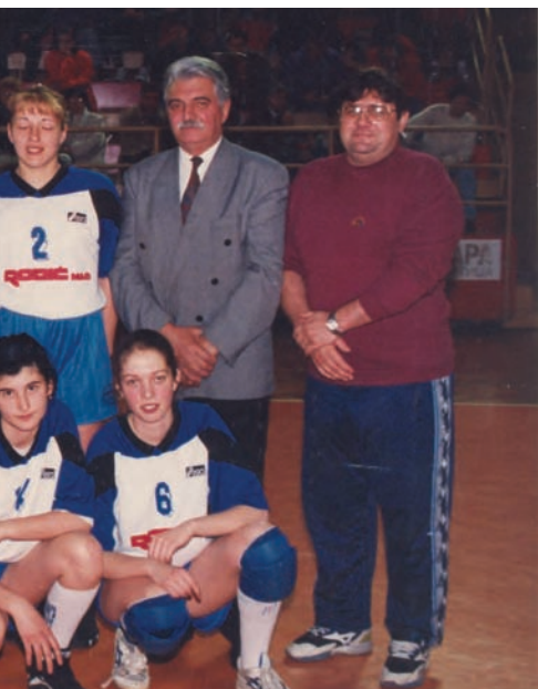
Rodić MB« slavije i sudionici Lige Kupa-Europe

Samo treba prebroditi tekuću prvoligašku sezonu u kojoj smo promijenili cijelu prvu postavu i napravili drastičnu smjenu generacija odlaskom najboljih igračica iz kluba, a za budućnost ne treba brinuti s obzirom