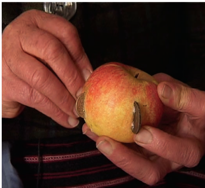
Gvozdeni novci u jabuki

* Jabuka ja dio obrednog ila na Badnje več. Posli zafalne zajedničke molitve čeljadima za astalom domaćin najpre iskriža (isječe) jabuku na toliko skala (kriška) koliko je čeljadi za astalom. Jabukom