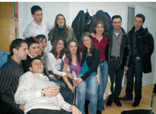
Mladi Golubinčani iz cijele Hrvatske i Golubinaca