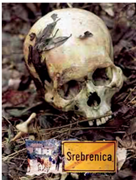
Najteži zločin u Europi nakon Drugoga svjetskog rata: Srebrenica

Koristeći se istim postupcima kao i u Hrvatskoj, Slobodan Milošević je u travnju 1992. godine pobunio Srbe u Bosni i Hercegovini. Glavni oslonac velikosrpske politike u BiH bila je Srpska demokratska stranka na čelu s Radovanom Karadžićem , koja