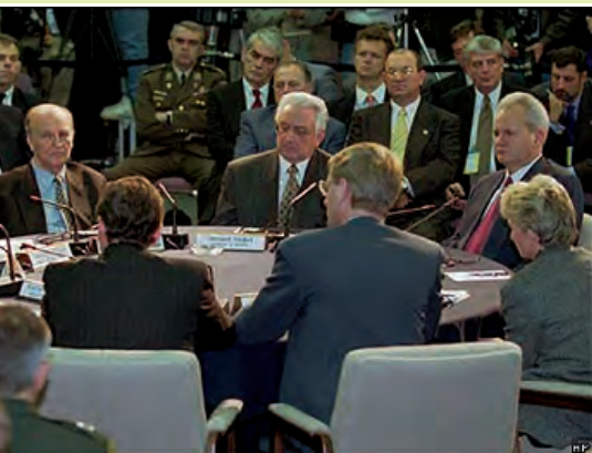
Nametanje mira: Dayton 1995. godine

Koristeći se istim postupcima kao i u Hrvatskoj, Slobodan Milošević je u travnju 1992. godine pobunio Srbe u Bosni i Hercegovini. Glavni oslonac velikosrpske politike u BiH bila je Srpska demokratska stranka na čelu s Radovanom Karadžićem , koja