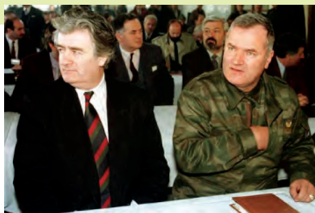
Srpski dvojac iz BiH još uvijek na slobodi: Radovan Karadžić i Ratko Mladić

je proglasila stvaranje tzv. Srpske autonomne oblasti Bosanska krajina i Srpske autonomne oblasti Jugoistočna Hercegovina.