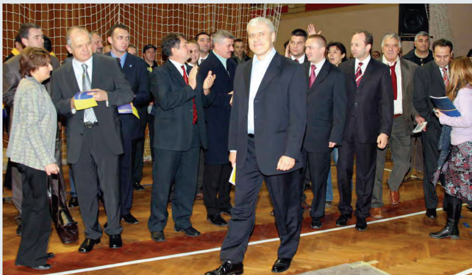
Demokratski kišobran za manjine: konvencija DS-a u Subotici