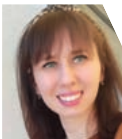
Piše: dipl. theol. Ana Hodak

25. kolovoza – Ljudevit kralj, Lajčo 26. kolovoza – Melkidezek, Branimir 28. kolovoza – Augustin 29. kolovoza – Mučeništvo Ivana Krstitelja 31. kolovoza – Josip iz Arimateje 2. rujna – Kalista 3. rujna – Grgur Veliki 5. rujna – Majka Tereza