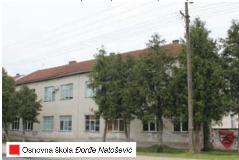
Osnovna škola Đorđe Natošević

ili nemaju vremena, ili ne žele učiniti da se nešto pokrene, a jedan čovjek ne može tu puno uraditi. Imali smo nekoliko pokušaja da se udruga ponovno pokrene, ali se nažalost nije nastavilo. Problem je i što nam je državnom revizijom dom oduzet. Dobili smo ponudu od lokalne samouprave da nam bude ustupljen na korištenje na 99 godina, ali mi na to nismo pristali i predali smo spise odvjetniku. Ono