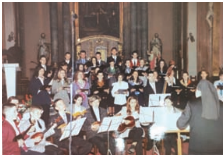
25. obljetnica zbora

Za naš tjednik još 2012. godine s. Mirjam Pandžić je rekla kako zbor najviše izvodi skladbe Albe Vidakovića , ali i rodoljubne i crkvene numere subotičkog skladatelja Milana Asića. Kada je u pitanju djelo Milana Asića, jednostavno je nemoguće sve nabrojati, no važno je naglasiti da je za zbor uglazbio čitav niz pjesama. Te skladbe nastajale su prigodom raznih slavlja i jubileja pjesnika, skladatelja, kao i za razne obljetnice među Hrvatima u Bačkoj. Sve skladbe su praižvedene u godini nastanka, ali se i danas izvode na raznim proslavama. U tu skupinu spadaju rodoljubne skladbe i skladbe na stihove pjesnika iz Bačke poput Ante Evetovića Miroljuba , Stipe Bešlića , Ante Jakšića , Jakova Kopilovića i Alekse Kokića . Neke od njih su Subotico bijela – 1981., Subotico mila – 1982., Domovina moja – 1983., Moja mati – 1982., Blago onom koji je cijeloga života svoga dijete – 1982., Jorgovane – 1983., Moje zvanje – 1981., Gospode, ti si