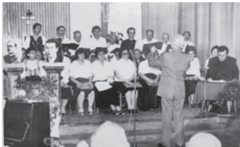
Dirigira Milan Asić

dopustio da budem pjesnik – 1982., Pozdrav Miroljubu – 1981. godine. Navedene skladbe napisane su za (četveroglasni) mješoviti zbor, a cappella ili uz pratnju klavira, ad libitum .