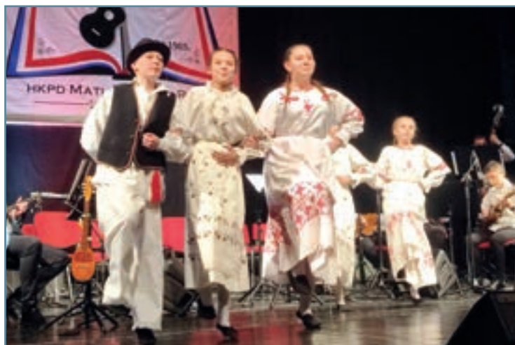
Tradicija u Rumi